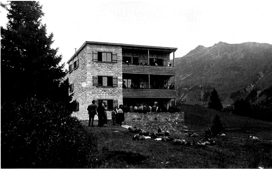
Jugendherberge Valbella. Der erste Bau von 1932 (historische Postkarte).

erkennen, entsprechend dem Umstand, dass teilweise in Fronarbeit gebaut wurde. Der klare Umriss des Baukörpers aber, das flach geneigte Pultdach mit minimalem Überstand, die liegenden Fensterformate und nicht zuletzt die Balkone an der Südfassade, die mit ihren Holzbrüstungen die Horizontalität betonten, waren aber deutlich der architektonischen Moderne verpflichtet. Vergleichbar mit zeitgenössischen Bauten von Rudolf Gaberel und mehr noch solchen Hans Leuzingers entstand so eine moderne und gleichzeitig spezifisch alpine Architektur. Der dreigeschossige Baukörper wirkte dabei durch seinen schlanken Grundriss fast wie ein Turm, umso mehr, als er völlig einsam aus den offenen Wiesen aufragte, die noch kaum von den heute charakteristischen Tannengruppen überwachsenen waren.