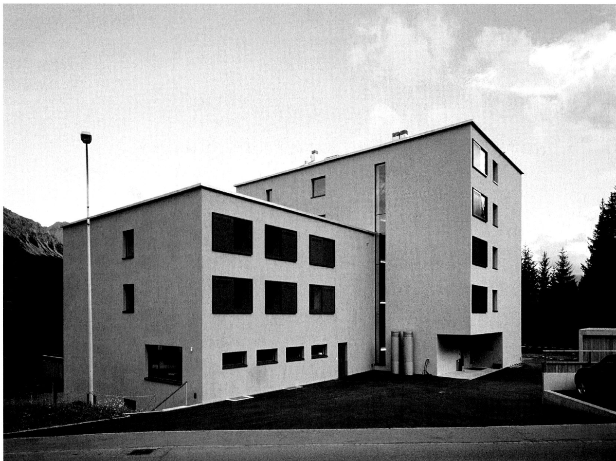
Jugendherberge Valbella. Ansicht von Nordwesten.

Baukörper, wie dies die Ansicht von unten suggeriert, oder um zwei, im rechten Winkel aneinander gefügte, wie es vom Hang her scheint, wohin sich eine Art Eingangshof öffnet? Stammt der Bau vielleicht aus der Zeit der Moderne mit seinem flachen Dach, seiner scharf geschnittenen Kubatur und seinem stolzen, ganz auf regionalistische Anspielungen verzichtenden Auftreten? Und doch wirkt er ganz gegenwärtig, nicht nur weil seine Oberflächen noch makellos sind, sondern auch aufgrund der Art seiner Fenster zum Beispiel mit ihren metallenen Schiebeläden, seiner Farbigkeit – rot und grüngrau – und seiner auf den Ort bezogenen Figuralität. Die Mehrdeutigkeit, die sich auch bei näherer Betrachtung als charakteristisch für den Bau erweist und wesentlich seine Qualität ausmacht, entspricht seiner Geschichte.