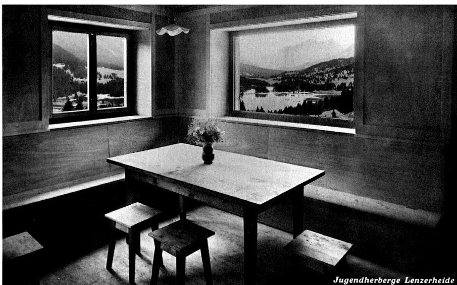
Jugendherberge Valbella. Blick aus dem Aufenthaltsraum von 1932 (historische Postkarte).

erkennen, entsprechend dem Umstand, dass teilweise in Fronarbeit gebaut wurde. Der klare Umriss des Baukörpers aber, das flach geneigte Pultdach mit minimalem Überstand, die liegenden Fensterformate und nicht zuletzt die Balkone an der Südfassade, die mit ihren Holzbrüstungen die Horizontalität betonten, waren aber deutlich der architektonischen Moderne verpflichtet. Vergleichbar mit zeitgenössischen Bauten von Rudolf Gaberel und mehr noch solchen Hans Leuzingers entstand so eine moderne und gleichzeitig spezifisch alpine Architektur. Der dreigeschossige Baukörper wirkte dabei durch seinen schlanken Grundriss fast wie ein Turm, umso mehr, als er völlig einsam aus den offenen Wiesen aufragte, die noch kaum von den heute charakteristischen Tannengruppen überwachsenen waren.