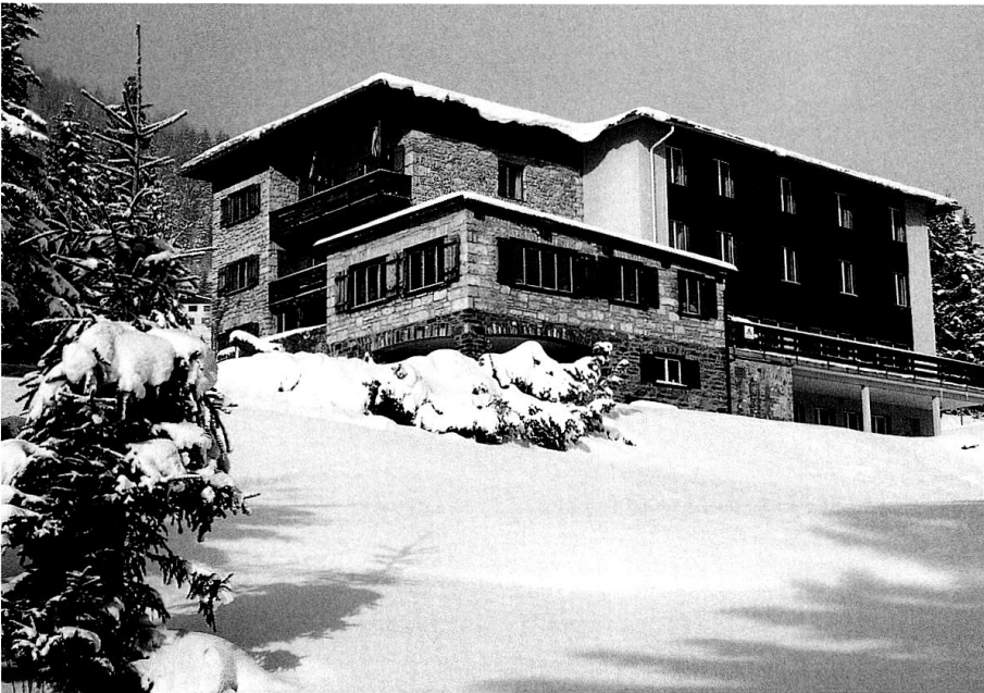
Jugendherberge Valbella. Das Gebäude nach den Erweiterungen von 1943 und 1972 (historische Post- karte).

Schon damals setzten im Aufenthaltsraum zwei Fenster über einer Eckbank die grossartige Sicht ins Tal in Szene, ein Thema, das 1943 bei der ersten Erweiterung um einen Vorbau im Erdgeschoss aufgenommen und ausgebaut wurde. 1972 wurde ein zweiter, wesentlich grösserer Anbau eröffnet, der mit einem neuen Zimmertrakt im rechten Winkel zum ursprünglichen Baukörper anschloss und beide Teile über ein Walmdach zu einem kompakten Konglomerat verband.