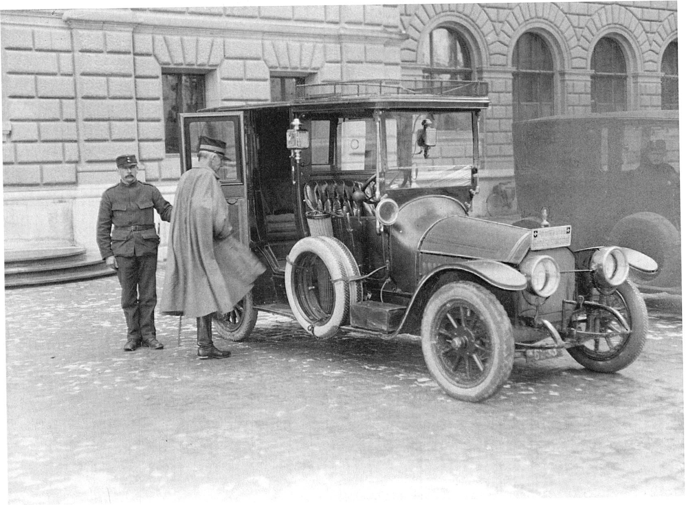
Der Generalstabschef steigt in seinen Dienstwagen vor dem Bundeshaus Ost (EMB).

bei militärischen Anlässen (Truppenparaden, Inspektionen) oder einem Einladungsreigen der Kantonsregierungen im Frühjahr 1915 kaum in der Öffentlichkeit gezeigt. Die Chance, sich mittels einer zielbewussten Öffentlichkeitsarbeit der Presse zu bedienen, um Goodwill für die Armeeführung zu schaffen, wurde nicht wahrgenommen.