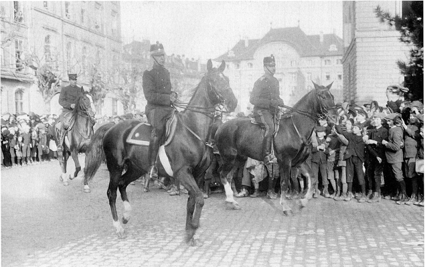
Der Generalstabschef reitet mit Offizieren des Armeestabs vor das Bundeshaus West (Schweizerische Grenzbesetzung. Heft III. Frobenius-Verlag, Basel, 1915).

In einer Eingabe an den Bundesrat vom 18. Juni 1918 wies Sprecher auf die unklaren Kompetenzabgrenzungen und Beziehungen zwischen Bund, Kantonen, militärischen Platzkommandos, Truppen der Armee und Polizeikräften hin und unterstrich die Notwendigkeit des Erlasses eines Gesetzes oder einer Verordnung über den «Belagerungszustand oder den Zustand des verschärften Schutzes.» 10 Er begründete seinen Vorstoss mit den rechtlich bisher unklar verbliebenen Verantwortlichkeiten, welche zielbewusstes Handeln hemmen würden: «Die derzeitige Unklarheit schliesst grosse Gefahren für alle in sich, die mit der Verhütung oder Unterdrückung öffentlicher Unruhen zu tun haben; die Verantwortlichkeiten sind nicht klar ausgeschrieben, und so besteht die Gefahr, dass niemand zu kraftvollem Handeln den Mut findet. Andererseits setzt sich jeder, der entschlossen eingreift, dem Vorwurf der Willkür aus [...]» Der rechtliche Hintergrund dieser Problematik bestand darin, dass die geltende Militärorganisation 1907 lediglich zwischen den Rechtszuständen des Friedensdienstes und des Kriegsdienstes unterschied, nicht jedoch die dazwischen liegende bewaffnete Neutralität erfasste. Aus dieser ungenügenden Rechtsgrundlage konnten sich bei einem allfälligen Ordnungsdiensteinsatz gefährliche Kompetenzkonflikte