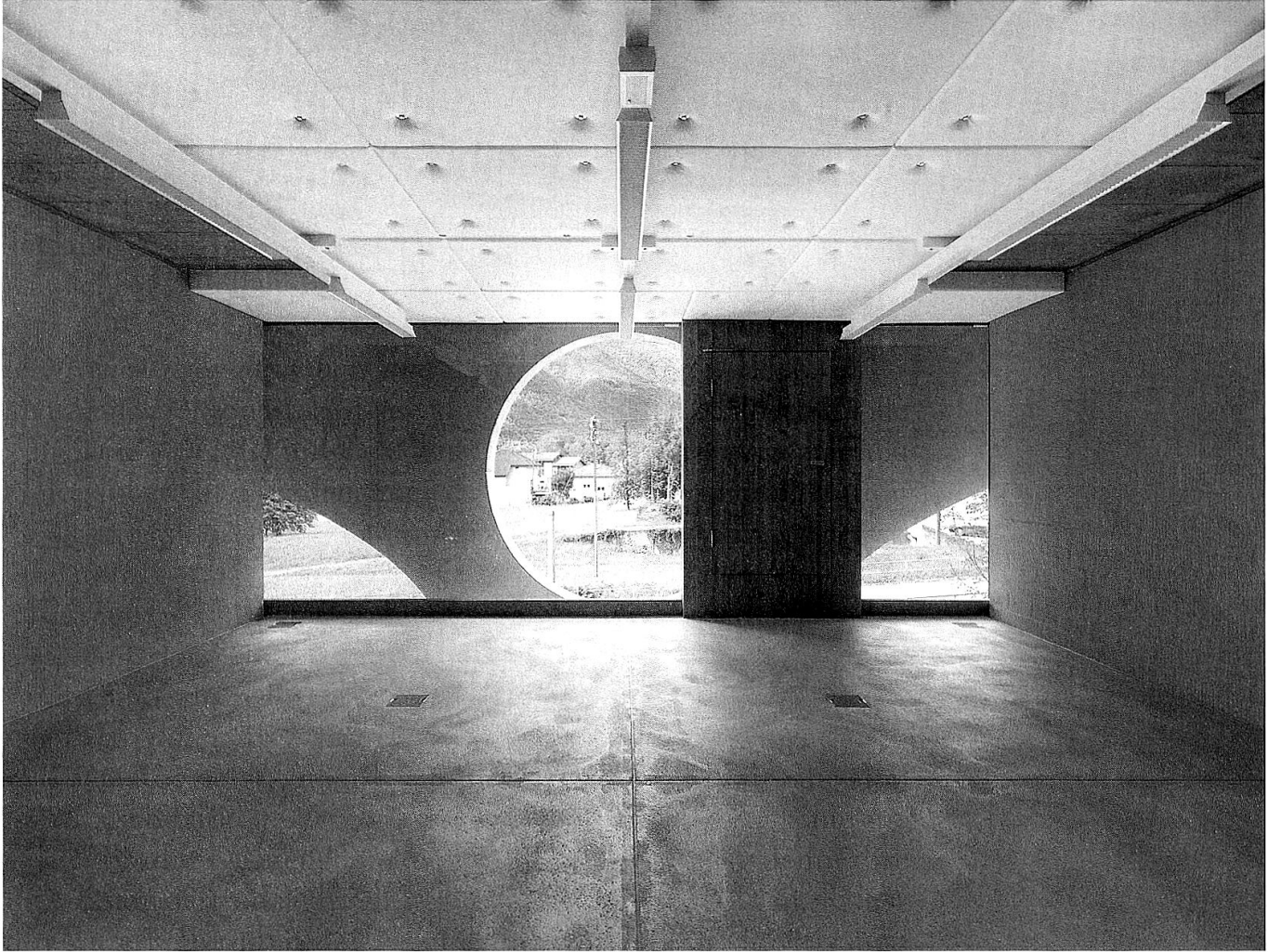
Handarbeitszimmer (Foto: Javier Miguel Verme).

durch die additive Fügung der mit einfachsten Mitteln hergestellten Ausbauelemente unterstrichen, die sich den Stahlbetonscheiben überlagern ohne sich mit ihnen optisch zu verbinden. Die aus den gleichen oder ähnlichen Lattenprofilen gezimmerten Fenster- und Türrahmen sowie die Belüftungsgitter, Garderobenmöbel und Beleuchtungskörper sind als aufgesetzte Elemente lesbar ohne jedoch die Dominanz der Tragstruktur in Frage zu stellen, die sich in der Aussengestalt des Gebäudes durch die starke Präsenz der Gesamttragstruktur manifestiert. Im Gebäudeinnern hingegen zeigt sie sich in den Teilansichten der geschwungenen Stahlbetonscheiben, die wiederum auf die äussere Gesamttragstruktur verweisen. Die punktuell in der Fassadenmitte abgestützten Kragsscheiben prägen die Raumempfindung der Anlage entscheidend: Sie ermöglichen facettenreiche Ausblicke in den Aussenbereich des Dorfzentrums und lassen umgekehrt die Innenraumgestalt des Gebäudes von aussen erkennen. Die Tragwerksdimensionen zur Bewältigung der beachtlichen Auskragungen wirken sich derart bestimmend auf den räumlichen Übergang zwischen