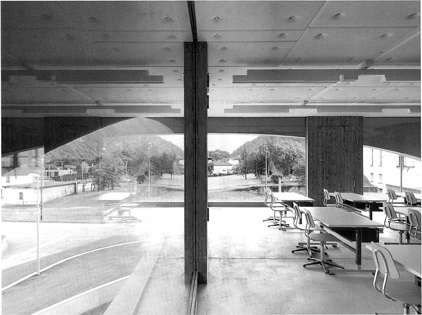
Schulzimmer (Foto: Javier Miguel Verme).

betonkonstruktion erforderlich gemacht. Der im Bogenscheitelpunkt platzierte Schlussstein, der den stabilisierenden Druck in der zweidimensionalen Mauerwerkskonstruktion gewährleistet, wurde in der überdeck geführten Stahlbetonkonstruktion des Schulhauses durch das Vorspannkabel ersetzt. Die Vorspannung setzt das Ellipsensegment dermassen unter Druck, dass die auf den Kragarm einwirkenden Zugkräfte überdrückt werden. Damit erhält das Ellipsensegment eine formale Legitimation, die über ihre archaische Konnotation hinaus als folgerichtiger Ausdruck eines vorwiegend auf Druck beanspruchten Tragwerks zu lesen ist.