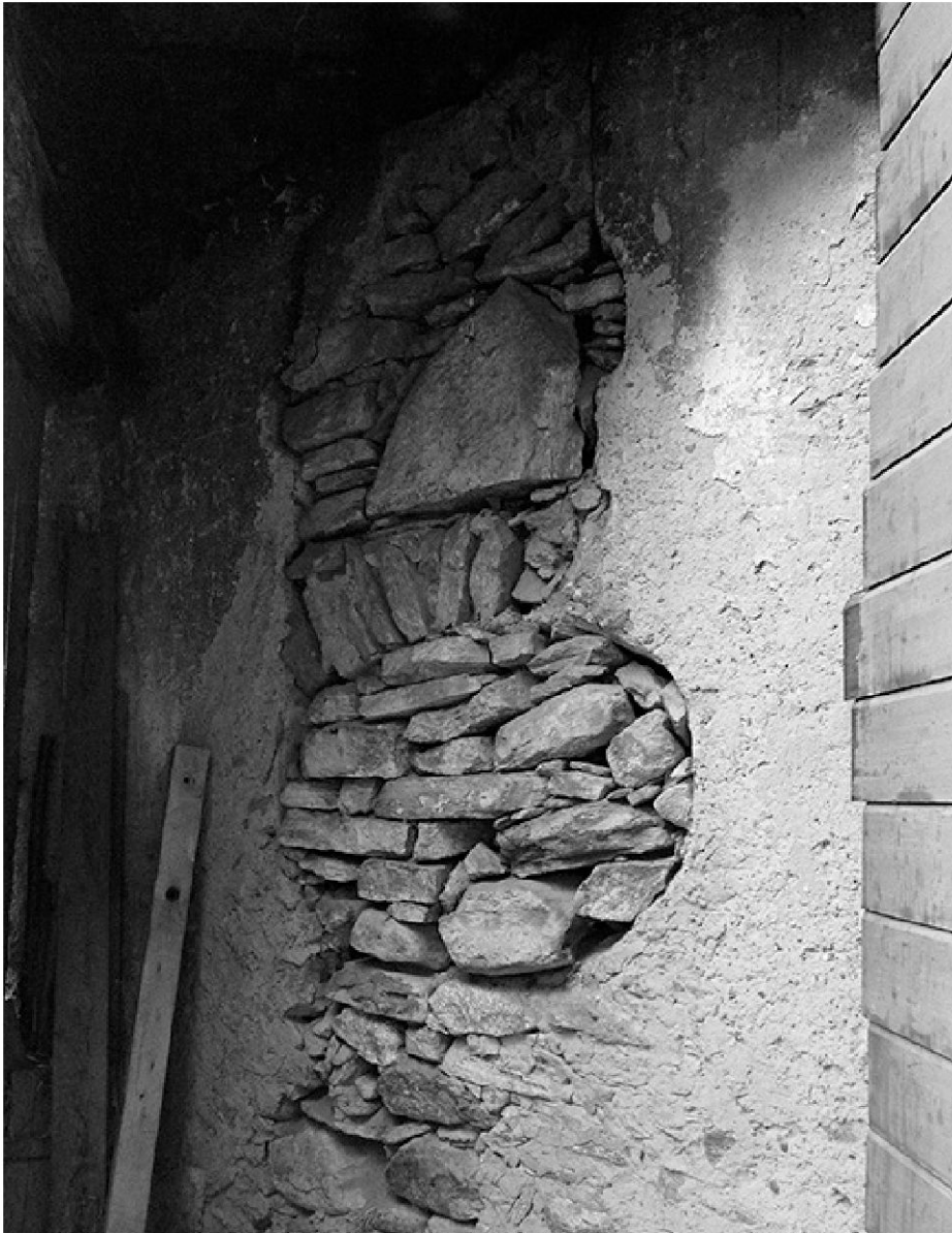
Übereinander angeordnete Öffnungen mit ungewöhnlichen Formen im Chorbereich auf Höhe des heutigen 1. Obergeschosses.

mit segmentbogenförmigem oberem Abschluss – vermutlich war hier ein Zugang zur Kapelle vorgesehen. 4 Die im Innern des Kapellenraums einheitlich verputzten Wände deuten darauf hin, dass der Durchgang an dieser Stelle nie fertig ausgeführt wurde. Die Beobachtungen an der Bausubstanz – das Raumprogramm des Erdgeschosses, die Bruchstellen im Mauerwerk, die Unregelmässigkeiten in der Gestaltung – verweisen auf eine sehr wechselvolle Baugeschichte, einerseits auf jüngere Veränderungen, andererseits jedoch auch auf Planänderungen während der Bauzeit. Geläufig ist, wie oben erwähnt, die Interpretation, dass eine im 18. Jahrhundert begonnene Kapelle nie fertig ausgeführt wurde und die bereits erstellten Fassaden später in den Bau des Wohnhauses integriert wurden. Bei Recherchen im Bischöflichen Ar-