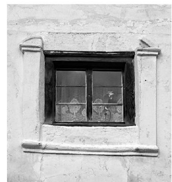
Stubenfenster mit aufstuckiertem Rahmen.

Eine Fotografie aus der Zeit um 1930 zeigt das Wohnhaus noch mit unverputzten Strickteilen. Diese waren mit Eselsrücken und Würfelfriesen verziert, wie man sie heute noch im unverschalten Bereich der Westfassade innerhalb eines angebauten Schopfs erkennen kann. Während sich das Haus in seiner heutigen Form nicht nur durch den bauplastischen Schmuck, sondern grundsätzlich durch die durchgehend verputzten Fassaden von den traditionellen Häusern der Umgebung abhebt, war sein Erscheinungs-