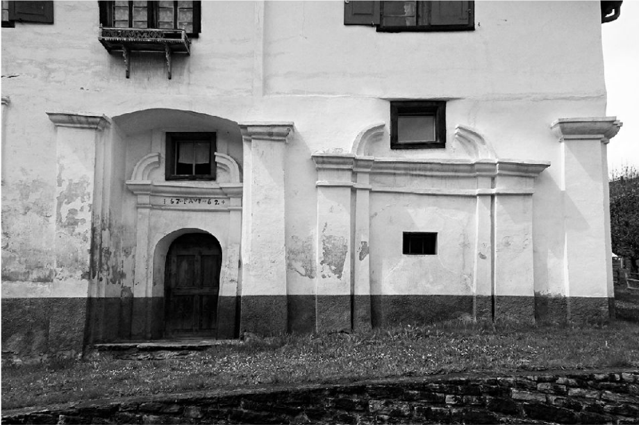
Die beiden mit Pilastern und gesprengten Giebeln gestalteten Portale an der Ostfassade des sog. Kapellenhauses.

die Obergeschosse führt, findet sich aufgemalt das Datum +17~FAVR~62+. 2 Neben der übergeordneten symmetrischen Pilasterordnung, die sich bis über die Mitte des ersten Obergeschosses hinaufzieht, sind zwei Portale skulptural ausgeformt. Das rechte davon, hinter dem sich der Grundriss einer Kapelle ausdehnt, ist bis auf eine kleine rechteckige Öffnung zugemauert. Das in der Giebelachse angelegte Hausportal liegt in einer Nische mit segmentbogenförmigem oberem Abschluss. Die beiden flankierenden Pilaster sind im Detail mit kleinen Abweichungen ausgestaltet: der nördliche mit einer Regennase und einer vergleichsweise «weicheren» Modellierung. 3 Der plastische Schmuck setzt sich wie beim Kapellenportal aus schlanken seitlichen Pilastern, barock profiliertem Gesims und gesprengtem Rundgiebel zusammen. Das nördliche Türgewände ist mitsamt dem Pilaster nicht im Lot, sondern weist eine Art Mauerverdickung im unteren Teil auf, wie sie oft bei starken Aussenmauern von Gebäuden zu beobachten ist. Aufstuckierten Bauschmuck findet man zudem zwischen den zwei linken Hauptpilastern um das Fenster der Stube im ersten Obergeschoss.