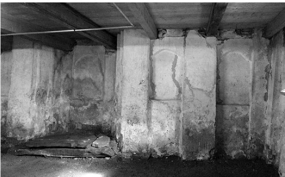
Der Kapelleninnenraum mit aufwändiger Wandgliederung, deren oberer Bereich durch den Einzug einer Balkendecke zerstört wurde.

seitig je eine tiefe Nische. Die nordseitige Nische zeichnet sich an der Aussenwand durch einen Mauervorsprung ab. Durch den nachträglichen Einzug einer flachen Balkendecke wurde die Wandgliederung des oberhalb des Sockelgeschosses liegenden Bereichs zerstört. Die Südwand des Kapellenraums weist sowohl von innen als auch vom Korridor aus sichtbare Veränderungen resp. Bruchstellen auf. In den Chorwänden sind von aussen zwei mit losen Steinen verschlossene Öffnungen gekoppelt mit darüber liegenden kleineren Öffnungen (ev. eine Vierpassform) erkennbar. Am Ort, wo sich heute die in den 1970er-Jahren verlegte interne Treppe wendet, gibt es im Chorbereich eine Art Nische