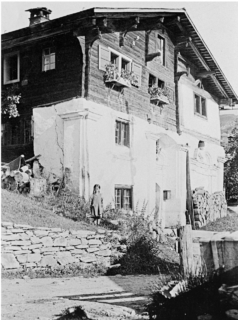
Ansicht des Hauses ca. in den 1930er-Jahren. Die hölzernen Aufbauten sind noch unverputzt und mit Würfelriesen und Eselsrücken verziert. An der Südostecke ist ein schadhafte Pilasterkapitell erkennbar (Foto aus Privatbesitz).

Den Kapellenraum in der nördlichen Haushälfte, dessen Apsis gegen Westen halbrund abschliesst, betritt man vom ebenerdigen Mittelkorridor des Hauses her. Auffällig ist im Innern die Strukturierung der verputzten Wände durch Wandpfeiler und dazwischen eingeschriebene Segmentbogenfelder sowie nord- und süd-