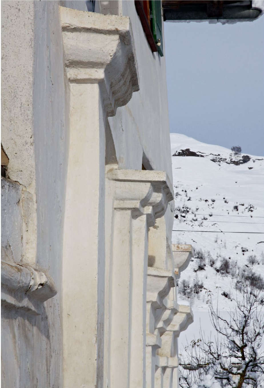
Detail der Pilastergliederung der Ostfassade des sog. Kapellenhauses.

te, zugleich Kapelle; sei es Bethaus, sei es privat, mit äusserst geschickten Händen errichtet».