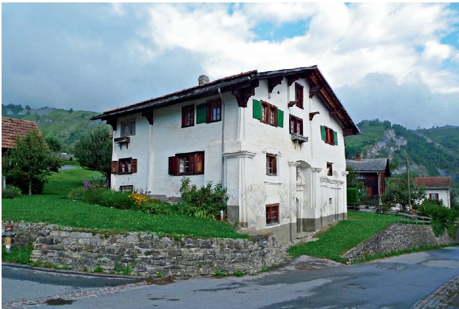
Ansicht des sog. Kapellenhauses an der Dorfstrasse von Surcasti im Lugnez von Südosten.

Eine durch Pilaster und Gesims gegliederte Fassade bildet heute die Hauptfront eines Wohnhauses oberhalb der Dorfstrasse in Surcasti. Über dem ostseitigen ebenerdigen Eingang, der in einen Mittelgang und von dort in Keller- und Werkstatträume sowie in