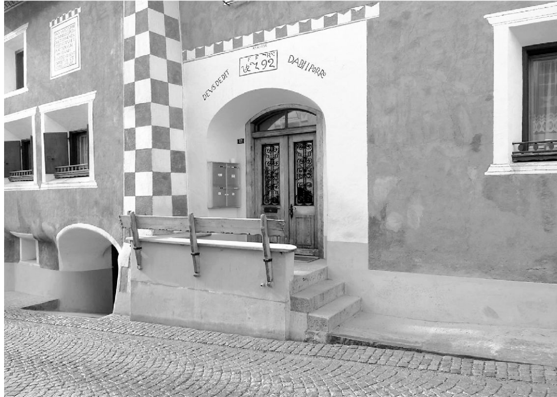
Engadinerhaus in Samedan, datiert 1792.

ren, hat sich heute zunehmend eine Haltung etablieren können, die man als organisch bezeichnen kann.