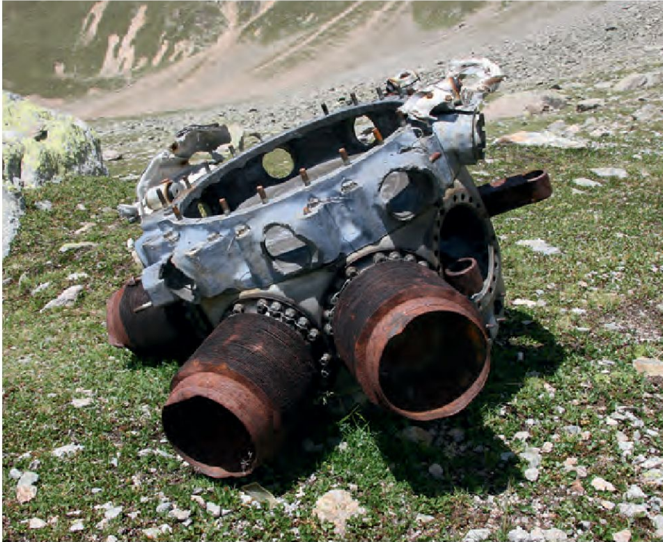
Motor des im Februar 1945 abgestürzten B-17-Bombers unterhalb des Piz Plazer, Val S-charl (Gem. Scuol) während der Dokumentation im Sommer 2013.

Bam Bola», ein amerikanischer B-24-Bomber, wurde am 12. 7. 1944 bei einem Angriff auf München getroffen, sodass die 10-köpfige Mannschaft und der Pilot Lt. B. C. Blanton über dem Bodensee abspringen mussten. Das per Autopilot gesteuerte Flugzeug stürzte auf der Riederer-Alp oberhalb Conters ab – Teile des Wracks wurden später geborgen und wiederverwendet, der Rest in einem Moor vergraben. All diese erhaltenen Flugzeugteile, ein Motor, ein 12,7-mm-Geschütz, aber auch persönliche Objekte der damaligen Besatzung (Unterhose, Thunfischdose etc.) wurden im Herbst 2002 durch das militärische Rettungsbataillon 35 ohne archäologische Begleitung geborgen und entsorgt (Compagno 2003 sowie Held 2002). Ein weiteres Wrack aus dem Zweiten Weltkrieg ist bis heute unterhalb des Piz Plazer im Val S-charl in der Flur «il bomber» (Gem. Scuol) bekannt (Grimm 2012, 143–144).