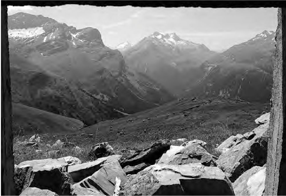
Andeer, Alp Lambegn/ Salegn. Ausblick aus der sog. Kanonenhütte auf Schützen- und Laufgräben des Ersten Weltkrieges.

stellen eingestuft werden können. Dies sei im Folgenden an Spuren aus der Zeit zwischen 1914 und 1945 veranschaulicht. Dass es sich dabei um historische Denkmale – auch im Sinne des Natur- und Heimatschutzgesetzes – handelt, sieht man am einfachsten, wenn man sich die Frage stellt: Ist das etwas von geschichtlicher Bedeutung? Niemand wird ernstlich sagen wollen und können, dass die beiden Weltkriege und ihre materiellen Hinterlassenschaften für Graubünden ohne historische Relevanz sind.