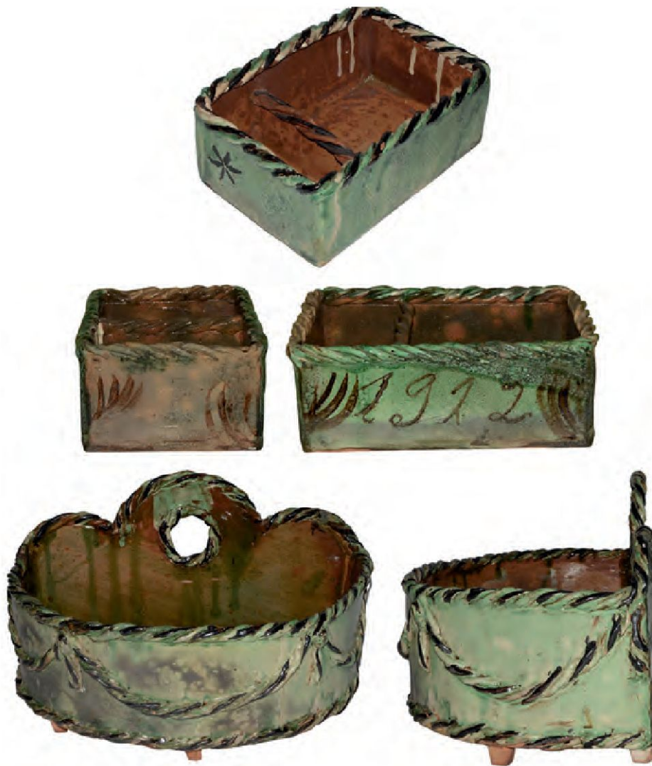
Neuzeitliche Keramik der Hafnerei S. A. Deragisch aus Bugnei/Tavetsch.

sungen im Dienste einer möglichst gesamtheitlichen Rekonstruktion der Vergangenheit. Die neuzeitarchäologischen Analysen führen dabei zu Resultaten, die einerseits das bekannte Wissen modifizieren und erweitern, andererseits aber dank der speziellen Aussagekraft der Artefakte neue Perspektiven eröffnen, die in dieser Weise aus Schriftdokumenten, Zeitzeugenberichten, Fotografien oder sonstigen Überlieferungen nicht bekannt sind. Schon für ältere Zeiten wurde stets betont, dass anhand der Artefakte Aspekte des täglichen Lebens erforscht werden können; dies gilt in gleichem Mass für die zeitgeschichtliche Archäologie. Die komplementäre Berücksichtigung weiterer historischer Schrift- und Bildquellen, wie es bereits für Untersuchungen mittelalterlicher oder neuzeitlicher Komplexe üblich ist, bietet für die jüngeren Zeitabschnitte zusätzlich die Chance, die verschiedenen Quellen und deren spezifisches Aussagepotential für die Interpretationen zu nutzen. Aktu-