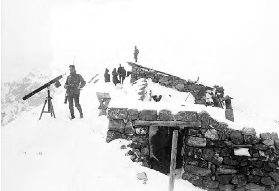
Der Schweizer Offiziersposten «Punta di Rims» während der Schweizer Grenzbesetzung – Aufnahme von Oblt. H. Escher, Bat. III, 91/92 (Staatsarchiv Graubünden, FN VIII A/83).

und dessen Hintergründe augenscheinlich (Beck 1973; ders. 1974 bzw. 1981): Der Zürcher Historiker entdeckte in den 1950er-Jahren oberhalb des Stilfserjoches mit seinen Studierenden eine in mehrere Fragmente zerbrochene Marmor-Gedenktafel ungarischer Infanteristen von 1918. Diese an den Besuch von Kaiser Karl I. im Jahr 1917 erinnernde, in deutscher und ungarischer Sprache abgefasste Memoria war möglicherweise während des Zweiten Weltkrieges von Italienern enteignet und die Trümmer dann über die südöstliche, ehemals österreichische und nunmehr italie-