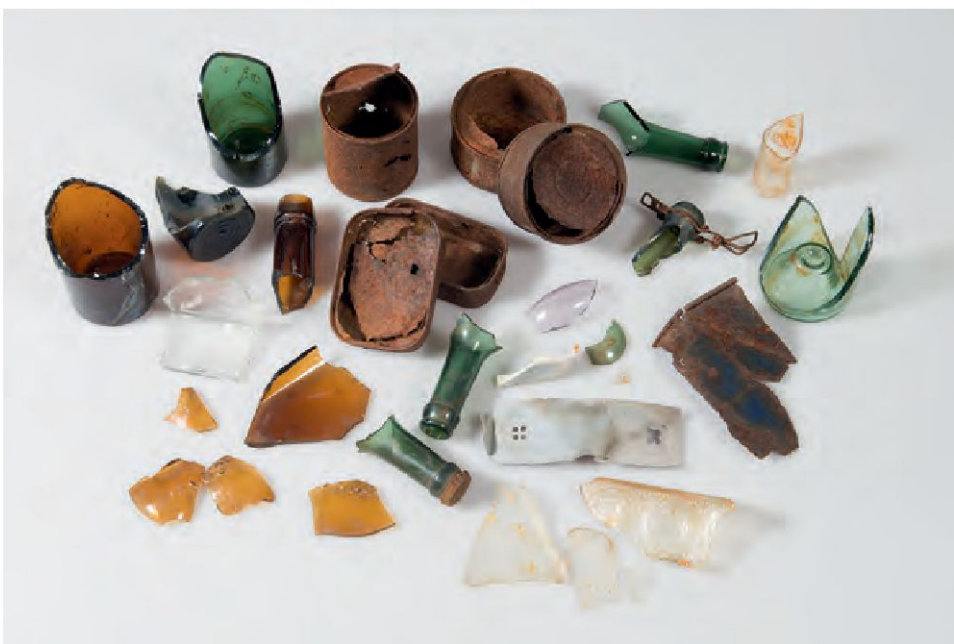
Inhalt einer Abfallgrube der Schweizer Armee nahe der Dreisprachenspitze – die Dinge als Zeichen des damaligen soldatischen Alltags.

und dessen Hintergründe augenscheinlich (Beck 1973; ders. 1974 bzw. 1981): Der Zürcher Historiker entdeckte in den 1950er-Jahren oberhalb des Stilfserjoches mit seinen Studierenden eine in mehrere Fragmente zerbrochene Marmor-Gedenktafel ungarischer Infanteristen von 1918. Diese an den Besuch von Kaiser Karl I. im Jahr 1917 erinnernde, in deutscher und ungarischer Sprache abgefasste Memoria war möglicherweise während des Zweiten Weltkrieges von Italienern enteignet und die Trümmer dann über die südöstliche, ehemals österreichische und nunmehr italie-