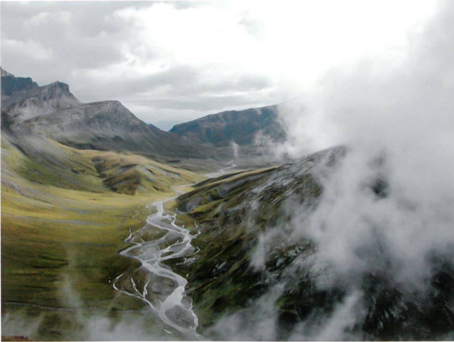
Blick in die Greina Richtung Passo della Greina.

Somit ist es naheliegend, dass der Turm gerade im Tourismus zu einem beliebten Ausdrucksmittel geworden ist. Er ist prädestiniert für die Inszenierung des Blickes, der gerade innerhalb der Tourismusbranche einen hohen Marktwert aufweist. Er schafft Aufmerksamkeit. Für unsere kapitalistisch orientierte (Tourismus-)Gesellschaft, die nicht selten weit weg ist von einer werthaltigen Tourismuskultur, hat dies höchste Bedeutung. Der Turm soll schnelle, überraschende und effektvolle Eindrücke bringen. Solche Leucht-Türme erhellen die Umgebung, nicht aber die kulturelle Zukunft.