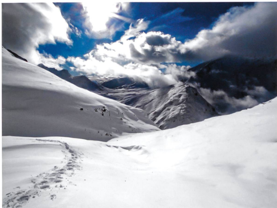
Blick vom Pass Diesrut in die Greina.

Vorstellung von einer vollends befreiten Natur noch die Inszenierung urtümlicher Lebensweisen können dem Anspruch auf Verwirklichung eines ganzheitlichen Lebensraumes genügen.