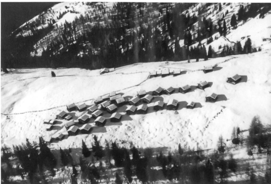
Die Wiesner Alp in einer historischen Aufnahme. So präsentierte sich die Siedlung, bis am 10. November 2007 ein Brand im nordwestlichen Teil 14 Hütten zerstörte.

Auf einem leicht ansteigenden Geländerücken gruppieren sich etwa vierzig Hütten und Ställe zu einer kompakten Siedlung. Sie ist noch tief verschneit. Wir bleiben in dieser wattierten Stille stehen, blicken ins Tal und augenblicklich wird uns klar, weshalb dieser Ort nicht nur Siedlungsforscher zum Verweilen lockt. Der Ort ist ein Idyll und die Aussicht schlicht phänomenal. Gegenüber am Horizont leuchten die Berggüner Stöcke im Mittagslicht, der Piz Ela, das Corn da Tinizong, der Piz Mitgel; dieses dominante Dreigestirn des Albulatales hatte einst auch den Expressionisten Ernst Ludwig Kirchner (1880–1938) in seinen Bann gezogen.