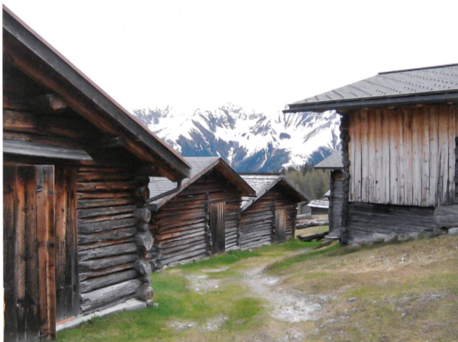
Der Zugang zu den Heustälen erfolgte ebenerdig von der Strassenseite.

13 Gebäude vollständig zerstört wurden und Streit wie Rechtschändel die Stimmung unter den Freizeit-Äplern vermiest haben: Verpasst wurde in der Folge vor allem, auf dieser Brandbrache gemeinsam eine gestalterische Vision zu realisieren.