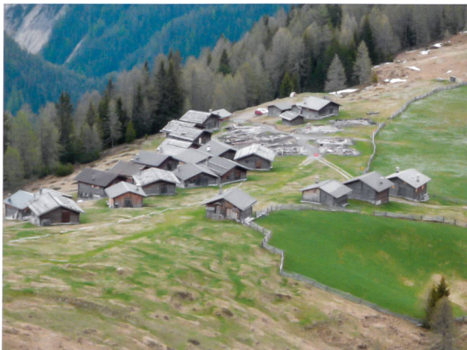
Rechts grenzt eingefriedetes Weidland an die sog. «soppa».