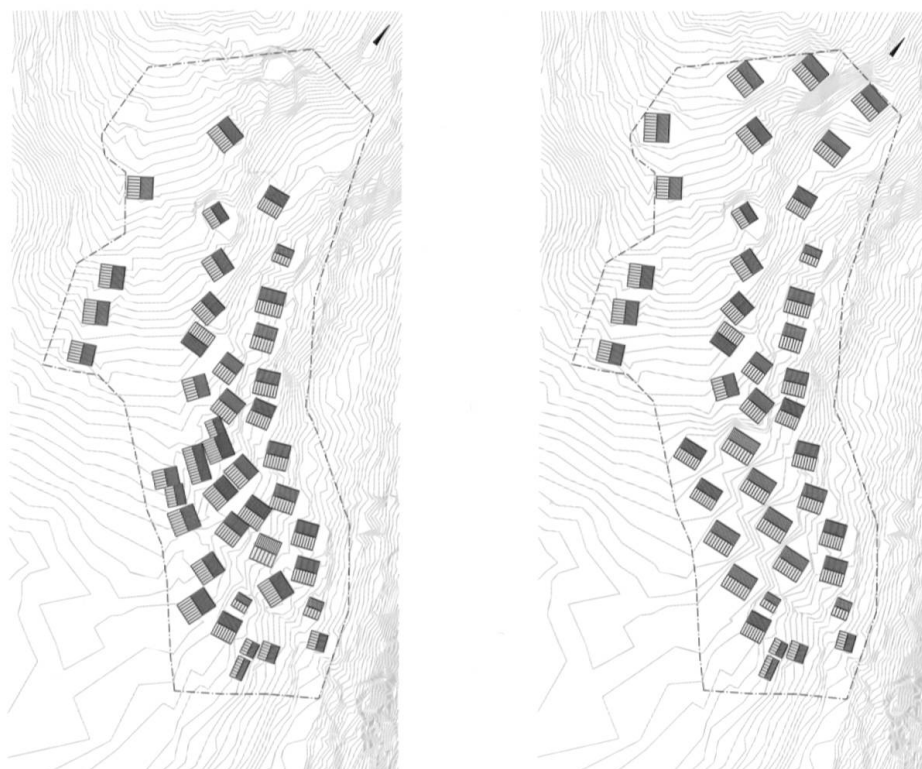
Die linke Skizze zeigt die ursprüngliche Siedlungsstruktur, die rechte die neue Siedlungsstruktur mit den neu definierten Aussenräumen.

an den Rand der Siedlung gestellt, die restlichen neun können am alten Ort gebaut werden.