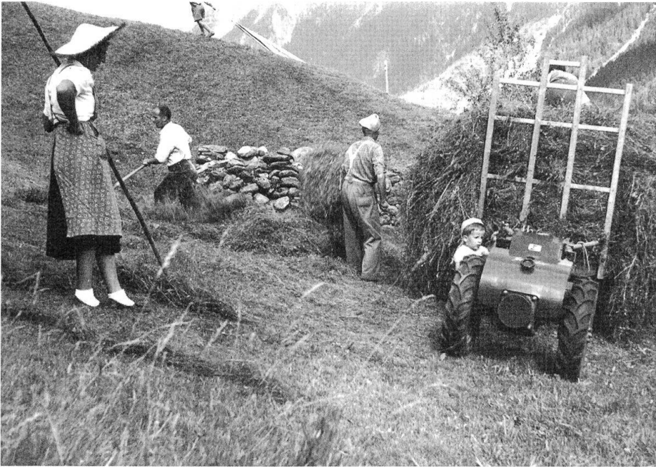
Abb. 11: Ab der zweiten Hälfte der 1940er-Jahre beginnt auch im Bergell der Einsatz von motorisierten Hilfsmitteln in der Landwirtschaft.