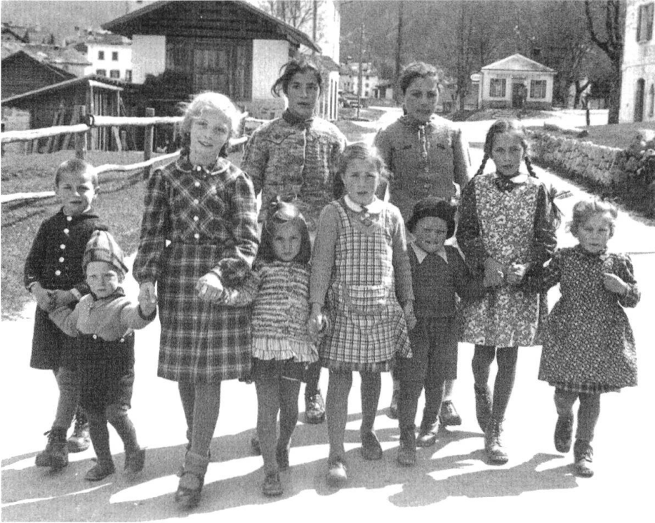
Abb. 15: Die älteren Mädchen passten auf die jüngeren Kinder auf. Auf der Strasse nach Borgonovo unterhalb des Hotels Helvetia bzw. der Garage Tam.