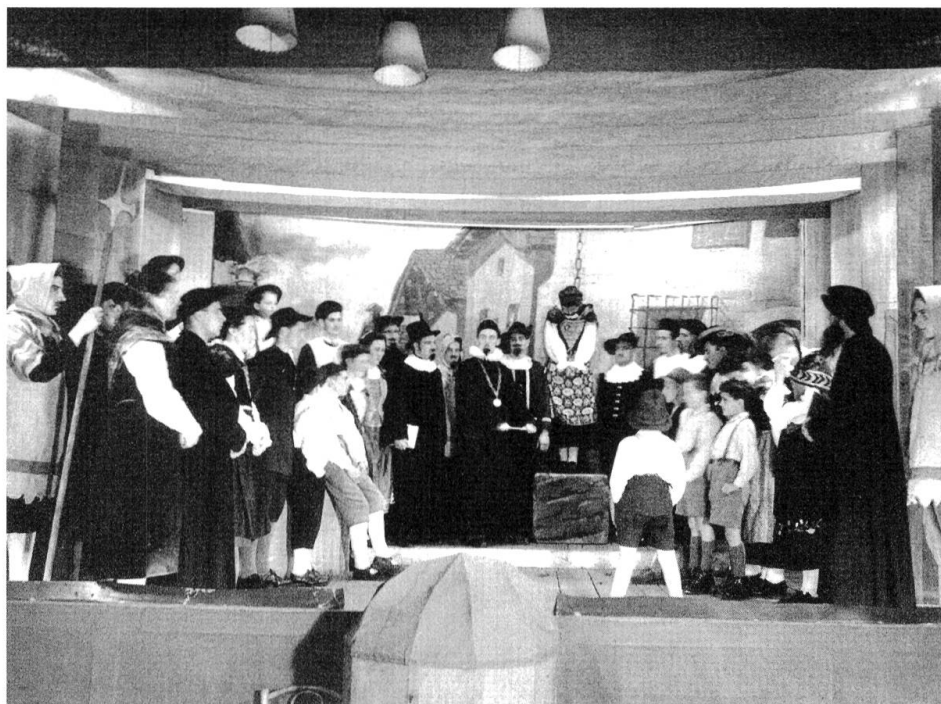
Abb. 18–19: Aufführung der «La Stria», 1930. Das Bühnenbild stammte von Giovanni Giacometti und wurde nach den Aufführungen im Hotel Helvetia eingelagert. Beim Brand 1945 soll es zerstört worden sein.