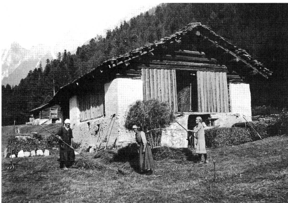
Abb. 05: Das an steilen Berghängen gemähte Heu wurde meist von Frauen im Gerlo hinunter zum Heustall getragen.