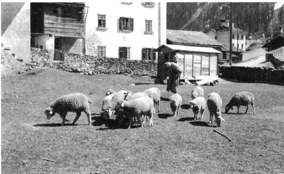
Abb. 06: Die Betreuung des Kleinviehs gehörte ebenfalls häufig zu den Aufgaben der Frauen.

Vom Frühling bis in den Herbst bewirtschafteten die Bauern ihre Wiesen und Weiden, die über verschiedene Höhenstufen verteilt lagen. War im Tal die Heuernte eingebracht, zog die Familie mit dem Vieh in die Höhe, nach Maloja, Grevasalvas, ins Fex oder auch nach Bivio. 1939 z. B. brachten die Bauern von Vicosoprano 234 Stück Rindvieh auf die Alpen. Später im Sommer stieg ein Teil der Familie – meistens waren dies die Männer – ins Tal, um das Emd einzubringen. Anschliessend kehrten sie wieder auf die Alp