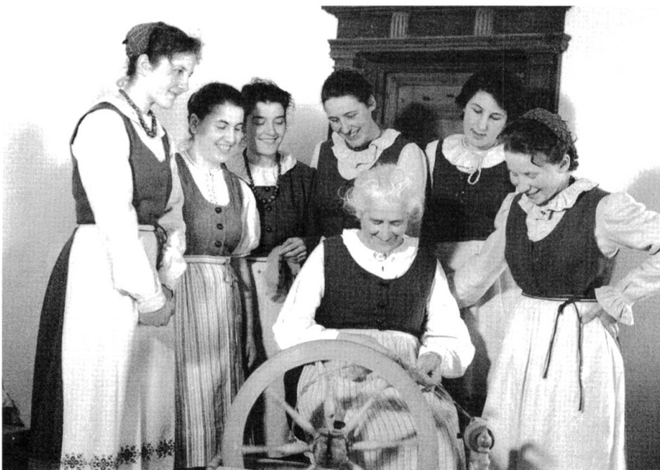
Abb. 20: Spinnkurs für die jungen Bergellerinnen, angeboten von der Società femminile Sopra-Porta.