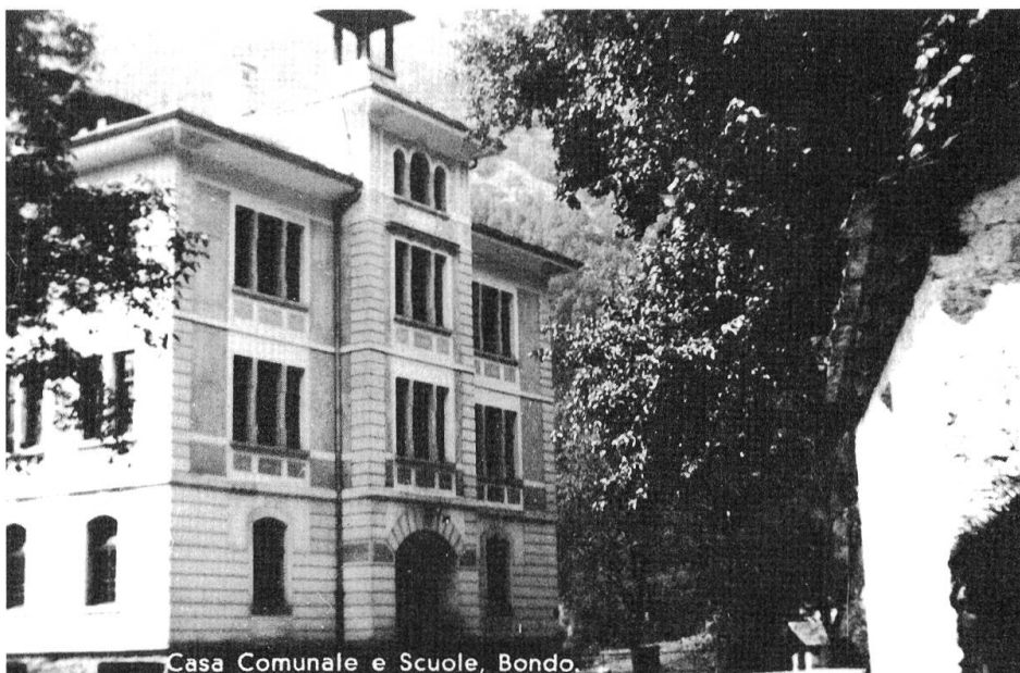
Abb. 12: Das von Architekt Ottavio Ganzoni 1905 erbaute Schulhaus in Bondo.

1935 wurden im Bergell 114 Gewerbebetriebe mit insgesamt 329 Beschäftigten, davon 131 Frauen, gezählt. 20 der 114 Betriebe befanden sich in der Gemeinde Bondo bzw. der dazugehörigen Fraktion Promontogno und beschäftigten 90 Personen. Davon waren 16 Frauen. Grösster Arbeitgeber im Tal war wohl das Baugeschäft des Architekten und Baumeisters Ottavio Ganzoni in Promontogno. In den ersten Jahrzehnten des 20. Jahrhunderts baute Ganzoni mehrere Häuser im Tal, etwa das Spital in Spino (1902), das schon erwähnte Hotel Helvetia in Vicosoprano (1903), das Schulhaus in Bondo (1905), in dem seit 2010 die Verwaltung der Gemeinde Bregaglia untergebracht ist, oder die Villa La Motta von Augusto Baldini in Orden/Maloja (1906). Ottavios Neffe Costantino Ganzoni, der das Technikum in Burgdorf besucht hatte, kehrte in den 1920er-Jahren ins Bergell zurück, trat in das Baugeschäft seines Onkels ein und wurde 1936 dessen Teilhaber. 30 Die Belegschaft des Baugeschäfts stammte zum Teil aus dem Bergell, so z. B. Maurer oder Handlanger. Mit letzteren kam es jedoch immer wieder zu Engpässen im Betrieb, weil sie gerade während des Sommers, wenn im Baugewerbe die meiste Arbeit anstand, als Hilfskräfte ausfielen, da sie auch Bauern waren und wegen der Heuernte zu Hause blieben. So wurden immer mehr Arbeiter aus dem grenznahen Italien, vor allem aus dem zwölf