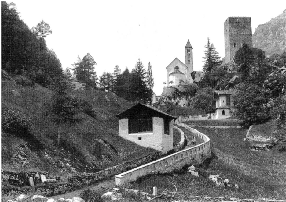
Abb. 01: Nossa Donna und Turm bei der Porta, die das Bergell bis Mitte des 19. Jahrhunderts in die beiden Gerichtsgemeinden Sopra Porta und Sotto Porta teilte.

nischen Grenze am Lovero bei Castasegna. Knapp oberhalb Promontogno trennt ein Felsriegel mit Befestigungsmauer, Porta genannt, samt Wehrturm und der Kirche Nossa Donna das Tal fast wie eine Talsperre in das obere und untere Bergell. 1