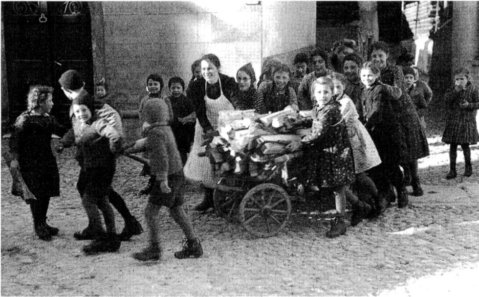
Abb. 14: In der Pause lieferten die Schulkinder dem Pfarrer Holz ins Pfarrhaus.

fen». 39 Der Turnunterricht blieb in Vicosoprano den Buben vorbehalten, da es in Graubünden bis 1961 den Gemeinden überlassen war, auch Turnen für Mädchen anzubieten. Einzig während des Zweiten Weltkriegs wurden die Mädchen einige Wochen lang am Morgen eine halbe Stunde vor dem eigentlichen Unterricht zum Turnen aufgeboten. Diese Neuerung wurde allerdings schon bald wieder aufgegeben. 40 Ab der ersten Klasse erhielten alle Schulkinder in der Regel von Montag bis Samstag am Vormittag und am Nachmittag je drei Stunden Unterricht, die Mädchen am Samstagnachmittag sogar fünf Stunden Handarbeiten. Nur der Mittwochnachmittag war frei. «Am Samstag hatten wir Mädchen kein Turnen, das gehörte sich nicht für Mädchen, Handarbeiten den ganzen Nachmittag, von ein bis fünf Uhr. (...) Wenn du von der Schule gekommen bist um halb fünf, schnell heim, einen Apfel essen, hast du Aufgaben machen müssen – hat man auch immer gehabt – und dann ist schon Abend gewesen; und um acht, im Sommer um neun, ‚suona l’Ave Maria‘. Wehe wenn dann noch ein Kind auf der Strasse gewesen ist; wenn dich der Lehrer gesehen hatte, gab es eine Strafaufgabe am nächsten Tag.» 41