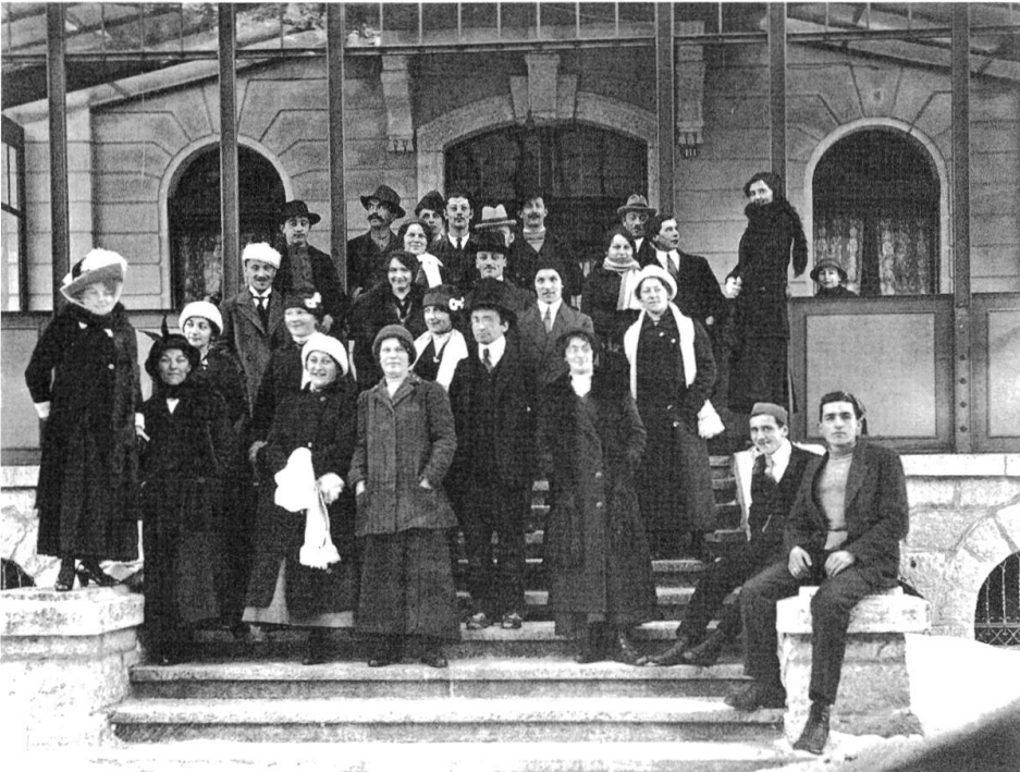
Abb. 04: Reisegesellschaft vor dem Hotel Helvetia.

Oberengadin, Gäste anzuziehen. Dieses relativ weite Hochtal mit Seen und viel Sonnenschein, das zudem an eine alte Bädertradition anknüpfen konnte, hatte es da wohl einfacher. 7 Die Hoffnungen der Bergeller Hoteliers, den Reisenden als Übergangsstation auf ihrem Weg ins oder vom Engadin zu dienen, erfüllten sich ebenfalls nur bedingt. Die immer besseren Verkehrsverhältnisse und die damit einhergehenden kürzeren Reisezeiten führten dazu, dass Touristen höchstens für eine Nacht blieben anstatt für einige Tage oder gar Wochen. 8 Mit Beginn des ersten Weltkriegs brach zwar auch im Engadin der Fremdenverkehr zusammen; er erholte sich dann aber in der Zwischenkriegszeit wieder. 1930 erreichte er z. B. in St. Moritz mit 628'362 Logiernächten einen neuen Höhepunkt, und trotz Wirtschaftskrise wurden 1935 immer noch 388'494 Übernachtungen gezählt. 9