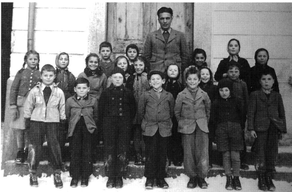
Abb. 71: Schülerinnen und Schüler der Unterstufe, 1946.

In touristischer Hinsicht galt das Bergell lange Zeit als Geheimtipp für Leute, die abseits des Engadins Ruhe suchten, sowie für Höhenwanderungen und Hochgebirgstouren. In den letzten Jahren ist jedoch das Angebot vielfältiger geworden, und es richtet sich an neue Kreise. Vor allem der junge Verein «Progetti d'arte in Val Bregaglia» erreicht in den Sommermonaten mit seinen Veranstaltungen mit Bündner und Schweizer Kulturschaffenden ein