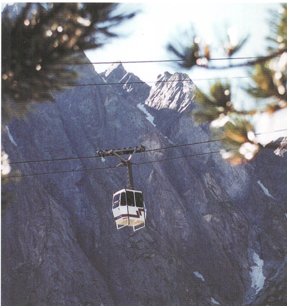
Abb. 66: Die zur öffentlichen Benutzung umgebaute ehemalige Werkseilbahn transportiert schnell und bequem hinauf auf die Albigna.

Wie die Zürcher im Zusammenhang mit der Umnutzung des ehemaligen Hotels Helvetia setzten auch die Talbewohner und -bewohnerinnen auf den Tourismus und versuchten, das noch kaum vorhandene Angebot auszubauen. Zwar galt unter Ferienreisenden von Deutschland nach Italien die Fahrt durch das Bergell mit einer Übernachtung im Tal als Insidertipp. Das Hotel Bregaglia beispielsweise war in den Sommermonaten regelmässig gut belegt. Mit der Eröffnung des San Bernardino-Tunnels 1967 blieben aber die Reisenden weg und die Übernachtungen brachen ein, erwies sich doch die Route durch den neuen Tunnel als schneller und erst noch als komfortabler. Umso willkommener war deshalb