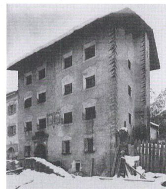
Abb. 69: Ciäsa Granda bei Stampa vor der Umwandlung in ein kulturelles Zentrum.

Abb. 68: Die «Panoramica» beginnt bei Casaccia und führt ausserhalb des Dorfes über eine Wiese zur bewaldeten Bergflanke. Links im Bild die Staumauer Albigna.