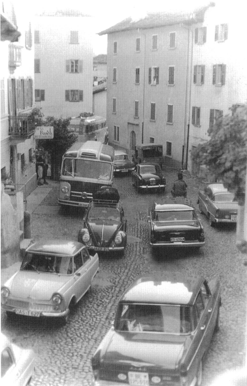
Abb. 64: Verkehr auf der Dorfstrasse in Vicosoprano vor dem Bau der Umfahrungsstrasse, um 1960.

beschloss die Regierung, das Dorf vom Autoverkehr zu entlasten und eine Umfahrung zu bauen. Da es sich dabei um eine kantonale Strasse handelte, übernahm der Kanton zwar die Kosten für deren Bau; für die Trottoirs hingegen hatte Vicosoprano aufzukommen. Die dafür vom Kanton veranschlagte Summe von Fr. 29'000 war nun dank den Einnahmen aus Steuern und Zinsen des EWZ für die Gemeinde gut verkraftbar. 8