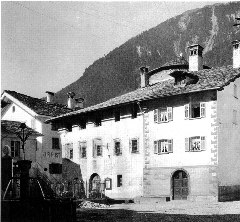
Abb. 63: Pretorio. Über dem Dach ist der oberste Teil des im 16. Jahrhundert einverleibten Rundturms zu sehen.

Anfangs der 60er-Jahre nahm der Autoverkehr auch im Bergell zu; ein Durchkommen auf Vicosopranos Dorfstrasse wurde immer schwieriger und für die Fussgänger immer gefährlicher. 1962