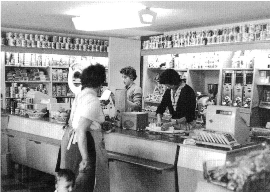
Abb. 65: Kolonialwarenladen Semadeni am Dorfplatz von Vicosoprano.

Freitage nach Zürcher Verhältnissen. Ebenfalls attraktiv war die Möglichkeit, günstig in einem der komfortablen neuen Häuser des Werks zu wohnen. 13