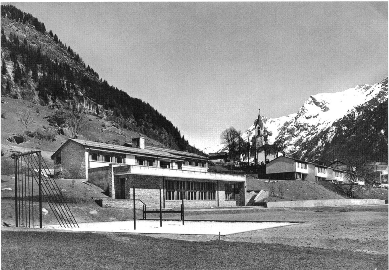
Abb. 61: Das von Architekt Bruno Giacometti gebaute neue Schulhaus in Vicosoprano, 1960.