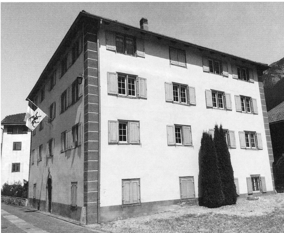
Das heutige Haus in Andeer der Erben Rosa Burga-Piccoli.