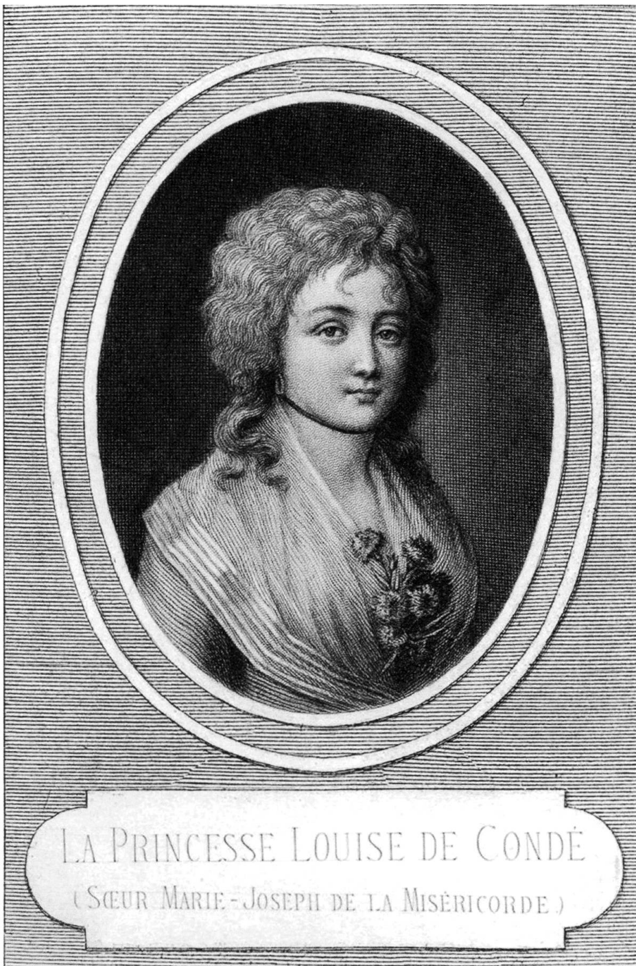
Portrait von Louise-Adélaïde de Bourbon-Condé (1757–1824). Aus: Créteineau-Joly, Jacques, Histoire des trois derniers princes de la maison de Condé. Prince de Condé, Duc de Bourbon, Duc d'Enghien, 2 Bde., Paris 1867. (Basel, Universitätsbibliothek, EfVII 124:2, Frontispiz)

Das Studium der Stammbäume der französischen Bourbonen hat ergeben, dass es sich um Louise-Adélaïde de Bourbon-Condé (1757–1824), eine französische Prinzessin aus einer Nebenlinie des französischen Königshauses und Cousine von Ludwig XVI., handelt. 1 Sie war die Tochter von Herzog Louis V. Joseph de Bourbon (1736–1818), Prince de Condé, 9. Herzog von Enghien und Pair von Frankreich, und ihrer früh verstorbenen Mutter Charlotte de Rohan (1737–1760). Ihr Bruder war Herzog Louis VI.