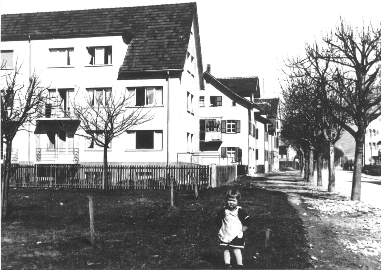
Schulstrasse in Landquart 1935, vor der Sanierung.

Die Freizeit verbrachten die Landquarter Kinder meist draussen. Die Wohnverhältnisse waren in der Regel beengt, über eigene Zimmer verfügten nur die Kinder der Wohlhabenderen. Ein beliebter Tummelplatz war der ausgedehnte Landquarter Föhrenwald. Gerne gingen die Kinder und Jugendlichen ganz einfach «uf d Gass», wenn Langeweile drohte. Irgendjemanden würde man dort mit Bestimmtheit antreffen und schon ergab sich ein Spiel. Zwar besaßen die meisten Landquarter Kinder nur wenig Spielzeug 8 , doch behalf man sich gerne mit Fantasie und «Selbermachen», wie es der Titel dieses Aufsatzes schon andeutet. Beliebt waren beispielsweise zerlesene «Jelmoli-Kataloge», welche die Fantasie anregten und immer wieder angeschaut wurden. Viele Kinder waren Sammlerinnen und Sammler. Die katholischen Kinder (Landquart ist gemischtkonfessionell) sammelten eifrig Heiligenbildchen, konfessionsübergreifend sammelten und erbettelten die Knaben gerne Briefmarken.