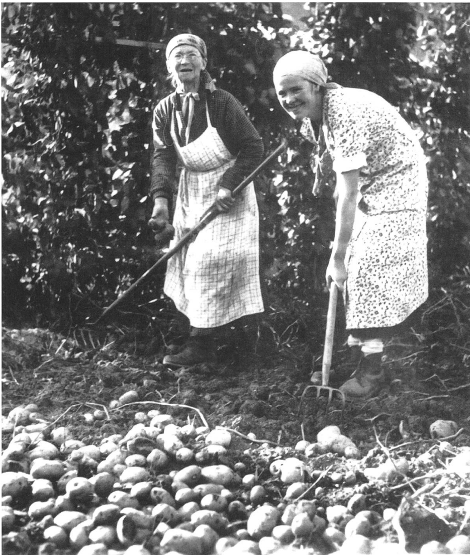
«Härdöpfel» – während des Krieges das wichtigste Nahrungsmittel. Als Teil des Plan Wahlen wurden sie auf jeder freien Fläche angepflanzt.

Die Rationierung der Lebensmittel brachte eine eintönige Kost mit sich, die beinahe ausschliesslich aus Kartoffeln bestand. Hartmann erinnerte sich ungern an das immer gleiche Essen. Wer etwas Fleisch auf den Teller zaubern wollte, hielt sich Kaninchen. Der Umgang mit Haustieren war damals viel unsentimentaler als heute. Jeder Quadratmeter verfügbare Erde wurde während der sogenannten Anbauschlacht dazu genutzt, um Kartoffeln, Gemüse oder Salate anzupflanzen. Auch die Hartmanns verwandelten ihren Garten in einen kleinen Acker. Nach Ausbruch des Krieges hatten sich einige Landquarter Einwohnerinnen und Einwohner, gerade die Reicherer, durch Hamsterkäufe schadlos gehalten.