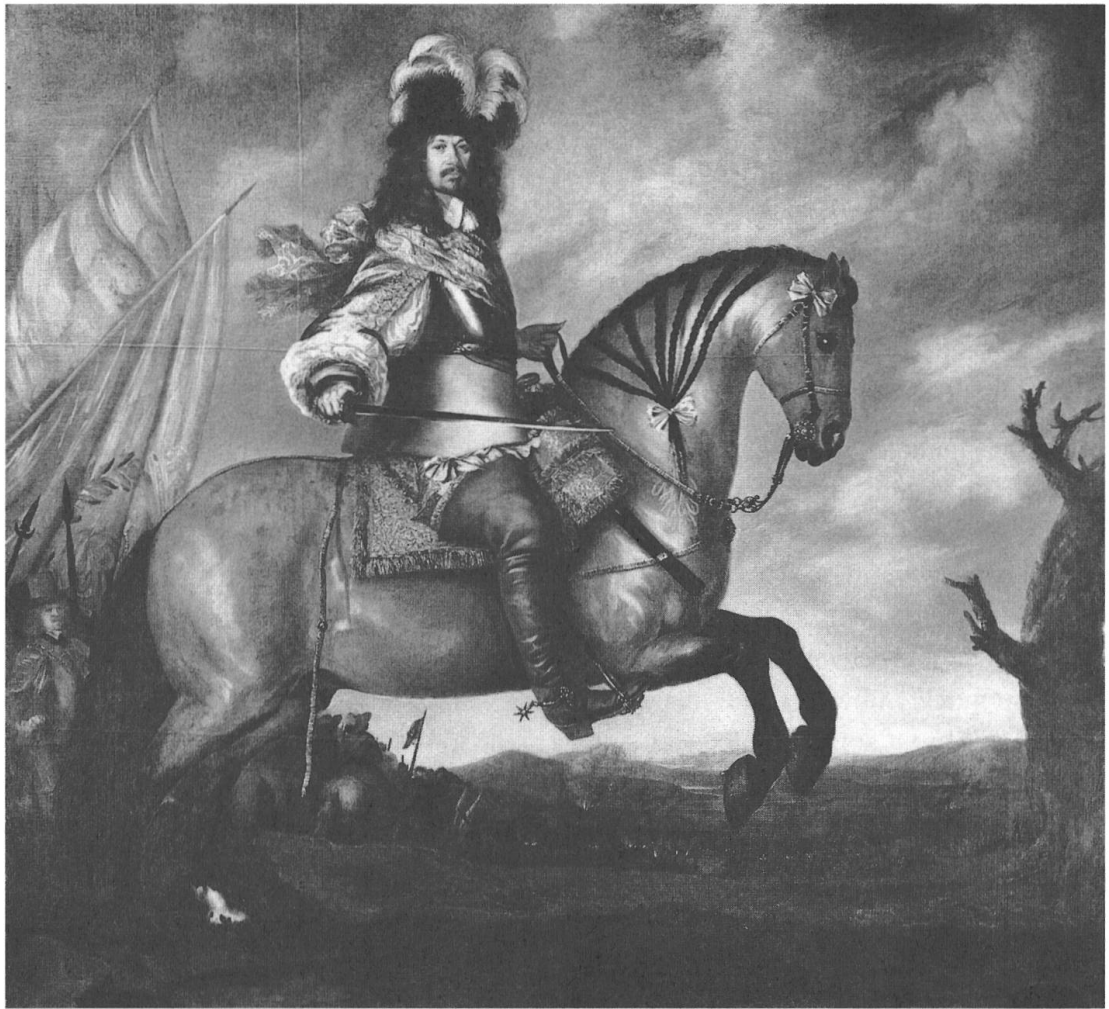
Abb. 2: David Klöckner Ehrenstrahl, Reiterporträt von Carl Gustaf Wrangel, 1652. Foto: Skoklosters slott, Inventar-Nr. 698.