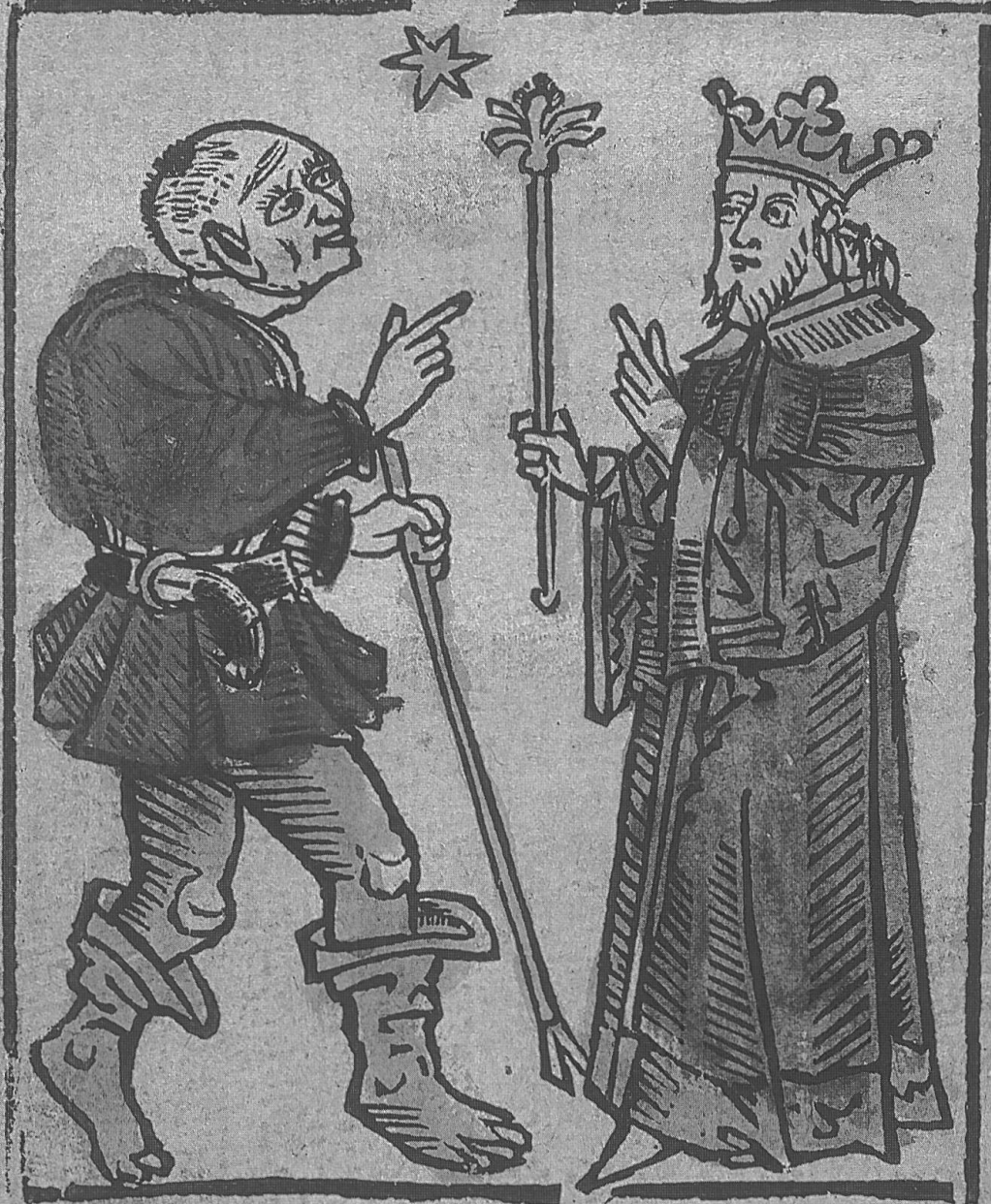
Abb. 6: Titelblatt der Collationes [Leipzig, K. Kachelofen, o.J.]: Markolf als kahler stultus vor König Salomon. Ex.: Uppsala KUB

I ncipiunt collatiōes quas dicuntur fecisse mutuo Rex salomon sapientissimus et Marcolphus facie deformis et turpissimus tamen ut fertur eloquentissimus feliciter