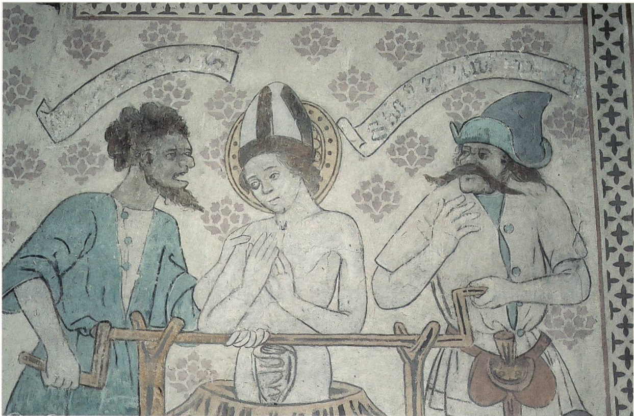
Abb. 9: Das Martyrium des Hl. Erasmus