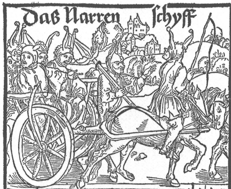
Abb. 6: Obere Hälfte des Titelblattes von Sebastian Brants „Narrenschiff“. 55