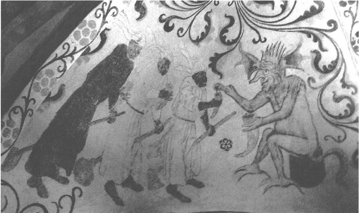
Abb. 2: Wandgemälde in der Kirche von Yttergran, Uppland, Schweden

In der frühen Neuzeit wurde der so genannte Blåkulla-Komplex ein wichtiges Element der Erzählungen über Hexerei in Schweden und Norwegen 26 und, obwohl die Geschichten sehr variieren, waren wenige Aspekte des Hexendiskurses in der frühen Neuzeit auch nur annähernd so vorherrschend wie die Erzählungen von grauenhaften Ritten zu diesen nordischen Hexensabbaten. An einem schwedischen Gerichtsverfahren von 1595 versuchte eine Frau, die der Hexerei angeklagt war, zwei andere Frauen hineinzuziehen, indem sie geltend machte, diese gehörten zu denjenigen, die nach Blåkulla zum Hexensabbat ritten („ thet slaget som pläga rida til Blåkulla “ (die Sorte, die nach Blåkulla zu reiten pflegt [Almquist 1939-51, II:166-67])). Genau dieses Bild wird die frühe Neuzeit hindurch wiederholt: In einem norwegischen Fall von 1730 sagte eine junge Frau, sie nähme eine Salbe aus einem Horn, schmiere damit verschiedene Tiere ein und reite auf ihnen, zusammen mit ihrer Großmutter, zu einem Platz genannt „Blaaekollen“: