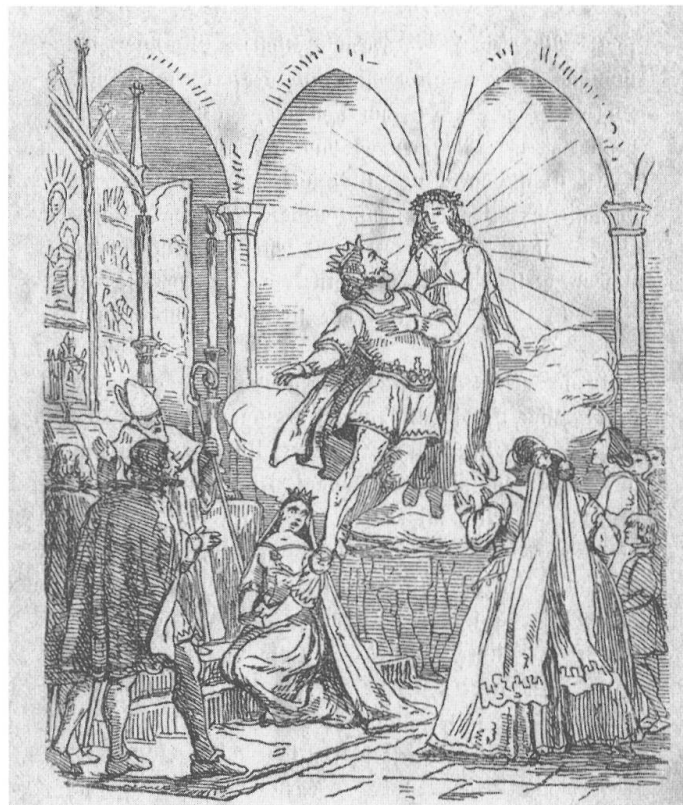
Abb. 3: Die Fee Morgua nimmt Holger Danske in ihr himmlisches Reich auf.