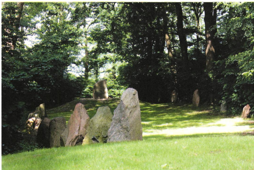
Billede 3: Glavendrupstenen og den rekonstruerede stensætning fotograferet fra en af bronzealderhøjene

Århundrede senere danner runestenen et centrum i en mindepark. 4 Det fremgår af de senere stens udtryk, at der kan lånes formelle, tekstuelle og indholdsmæssige elementer fra runestenen; stenene indgår i en dialog på tværs af tid. Eksempelvis er genforeningsstenen fra 1920 ligesom runestenen af rødtligt granit, den anvender en vertikal skriveretning, som er typisk for runesten, og indskriften danner et bånd langs fladens kant (en indramning, som dog ikke ses på Glavendrupstenen). Det fremgår tydeligt, hvem afsenderen er, nederst på stenens flade står der, at “Foreningen Glavendrupstenen satte mindesmærket”. Heller ikke denne stens funktion er begrænset til ønsket om at fastholde en udvalgt begivenhed, den er også orienteret mod erindringskulturen selv.