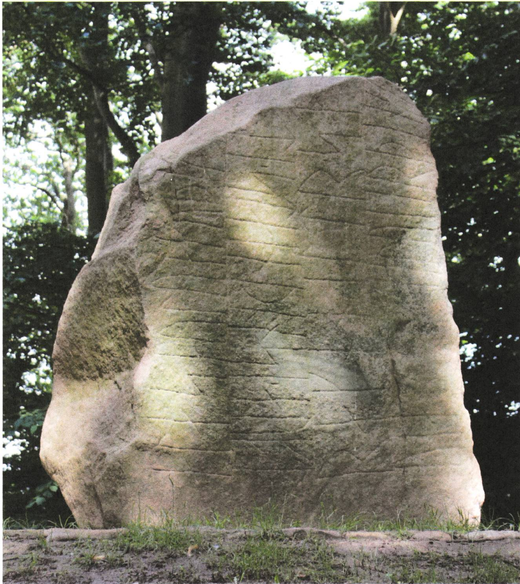
Billede 1: Glavendrupstenen er tætbeskrevet på tre sider, her ses stenens A-side. Indskriften begynder nederst i anden linje fra højre