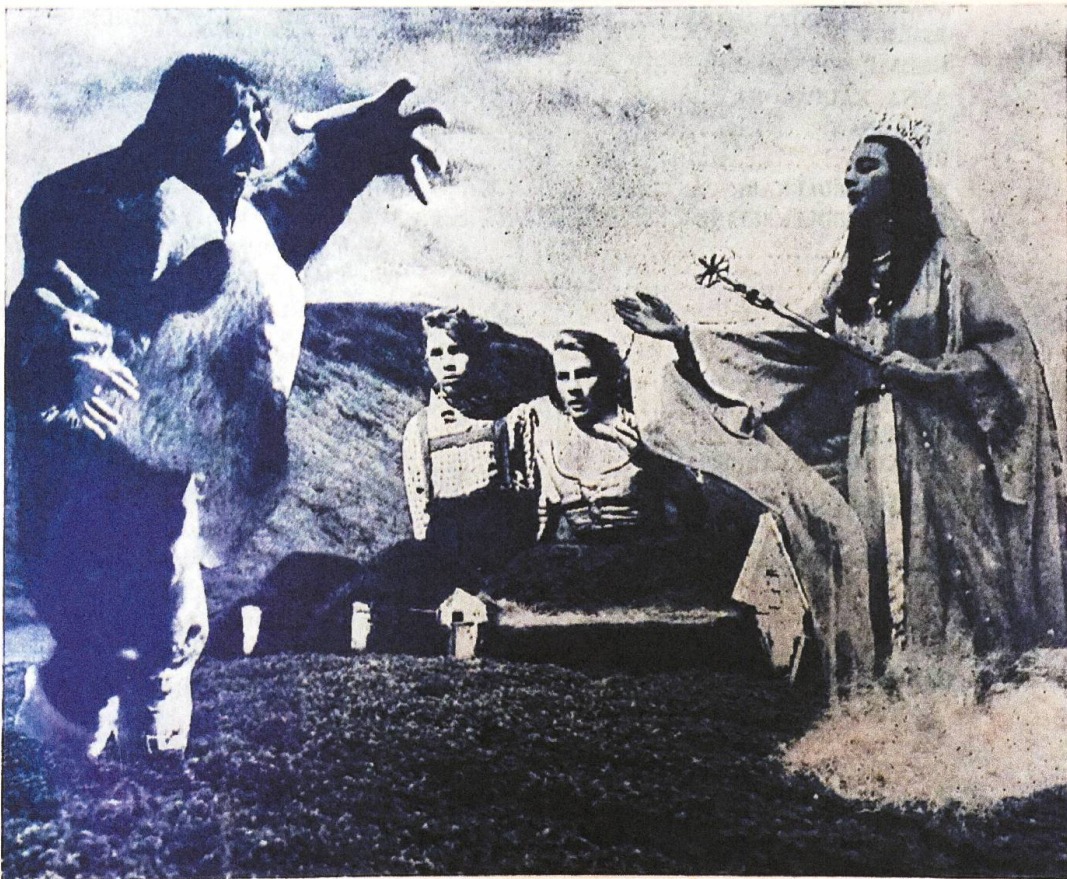
Abbildung 1: Programmheft zum Film Síðasti bærinn í dalnum von Óskar Gíslason

Kvikmyndun og framkvæmdastjórn: ÓSKAR GÍSLASON