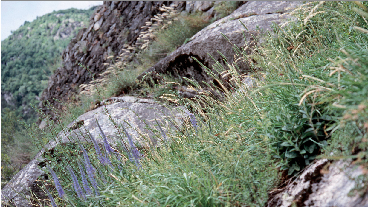
Foto 32: Thermophile Felsheide in Nossa Donna, nordöstl. Promontogno. Juli 2005.