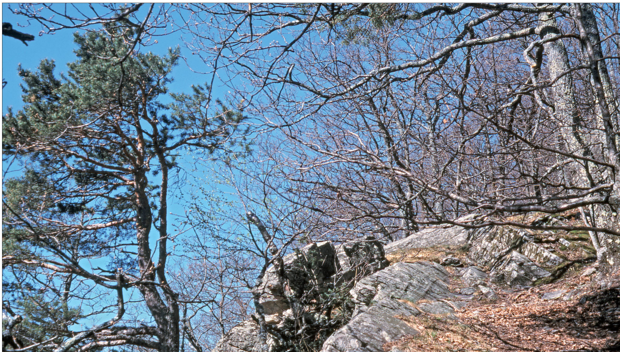
Foto 31: Gneisfelskopf mit Traubeneichen und Waldföhre. Ganda. März 2000.

Bemerkenswerte Pflanzenarten: Galeopsis pubescens (Weichhaariger Hohlzahn), Minuartia laricifolia (Nadelblättrige Miere), Genista germanica (Deutscher Ginster), Genista tinctoria (Färber-Ginster), Cytisus nigricans (Schwarzwerdender Geissklee), Orobancha rapum-genistae (Ginster-Würger), Orobancha gracilis (Schlanker Würger), Hippocrepis emerus (Strauchwicke), Anthericum liliago (Astlose Graslilie), Lilium croceum (Orangerote Feuerlilie), Jasione montana (Berg-Jasione), Allium sphaerocephalon (Kugelköpfiger Lauch), Trifolium rubens (Purpur-Klee), Carex humilis (Niedrige Segge).