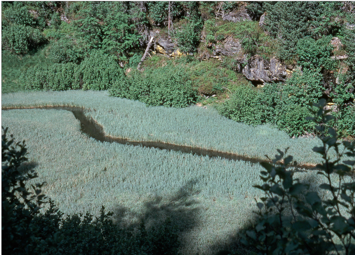
Foto 35: Schnabelseggensumpf entlang der Aua da Cavloc, Val Forno. Juni 2000.