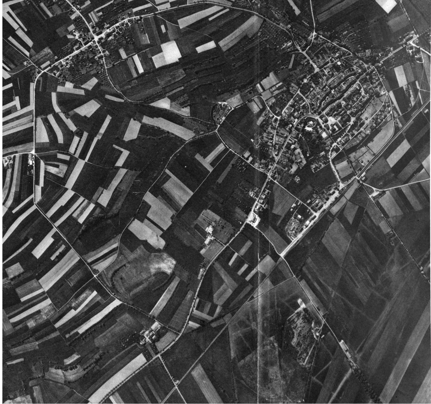
Pl. I. Vue aérienne d'Avenches en 1954 (voir p. 62).