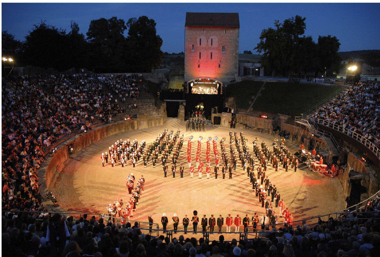
Fig. 13 La 6 e Aventicum Musical Parade à l'amphithéâtre.

Théâtre et amphithéâtre ont en outre accueilli plusieurs cérémonies militaires.