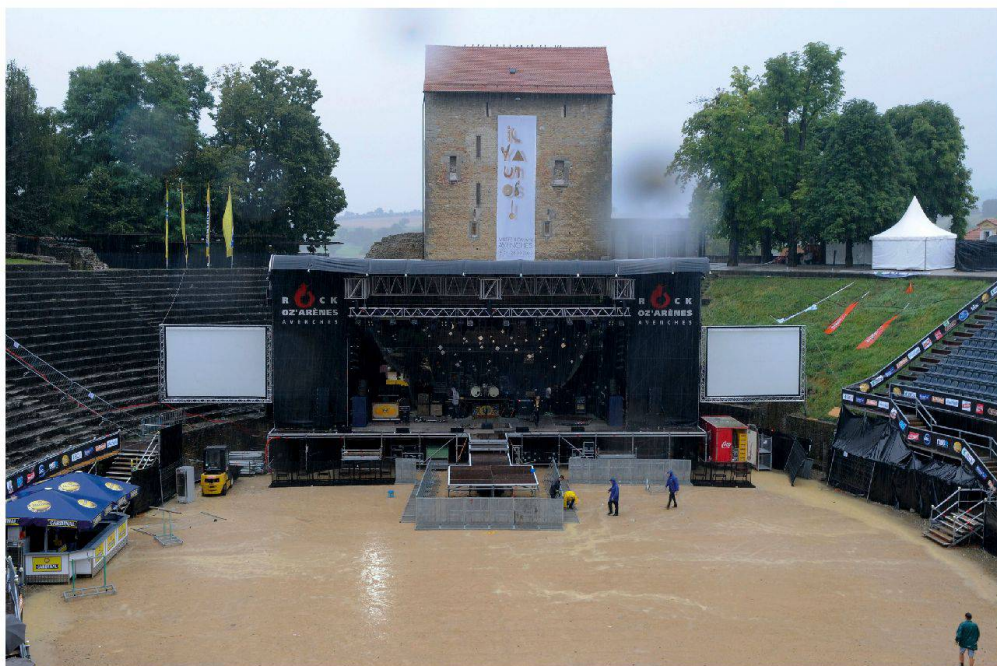
Fig. 12 L'amphithéâtre sous la pluie peu avant le concert du 12 août de Rock Oz'Arènes.

du 18 e Carnaval Avenchois et le Slow up qui a fait étape au Rafour le 27 avril 2008.