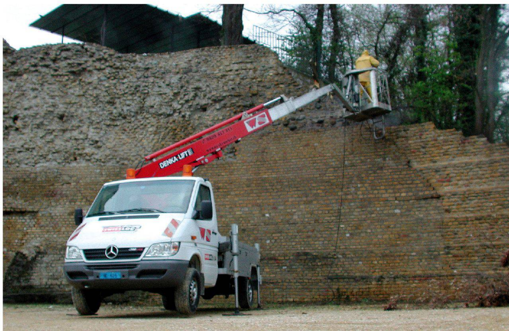
Fig. 4 (ci-contre) Amphithéâtre. Nettoyage et consolidation provisoire du mur semi-circulaire du Rafour.