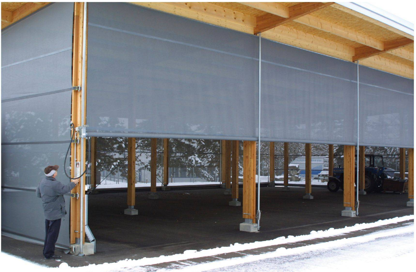
Fig. 1 Nouveau hangar des collections du Musée romain d'Avenches au dépôt de la route de Berne.

En effet, la Section Projets et Travaux du Service Immeubles, Patrimoine et Logistique (SIPAL) de l'État de Vaud a fait construire, durant l'été 2008, un imposant hangar à charpente de bois collé, parois de filets et toiture de métal (fig. 1).