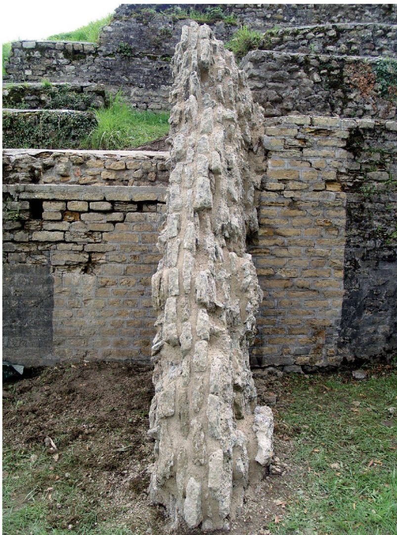
Fig. 2a et 2b

Théâtre du Selley, restauration du fragment écroulé de voûte M 90.3 par regarnissage des joints. État après et avant les travaux.