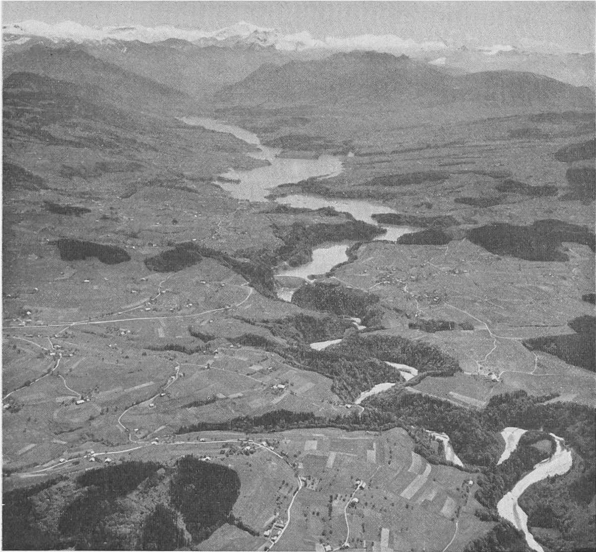
La Sarine, entre Fribourg et Gruyères