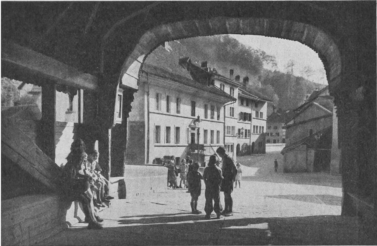
Sous l'arche vétuste du pont couvert, conciliabules de philosophes en herbe