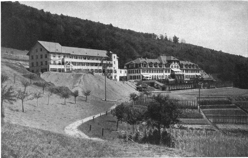
Margauische Heilstätte Barmelweid Links: Neubau — Rechts: Alter Teil