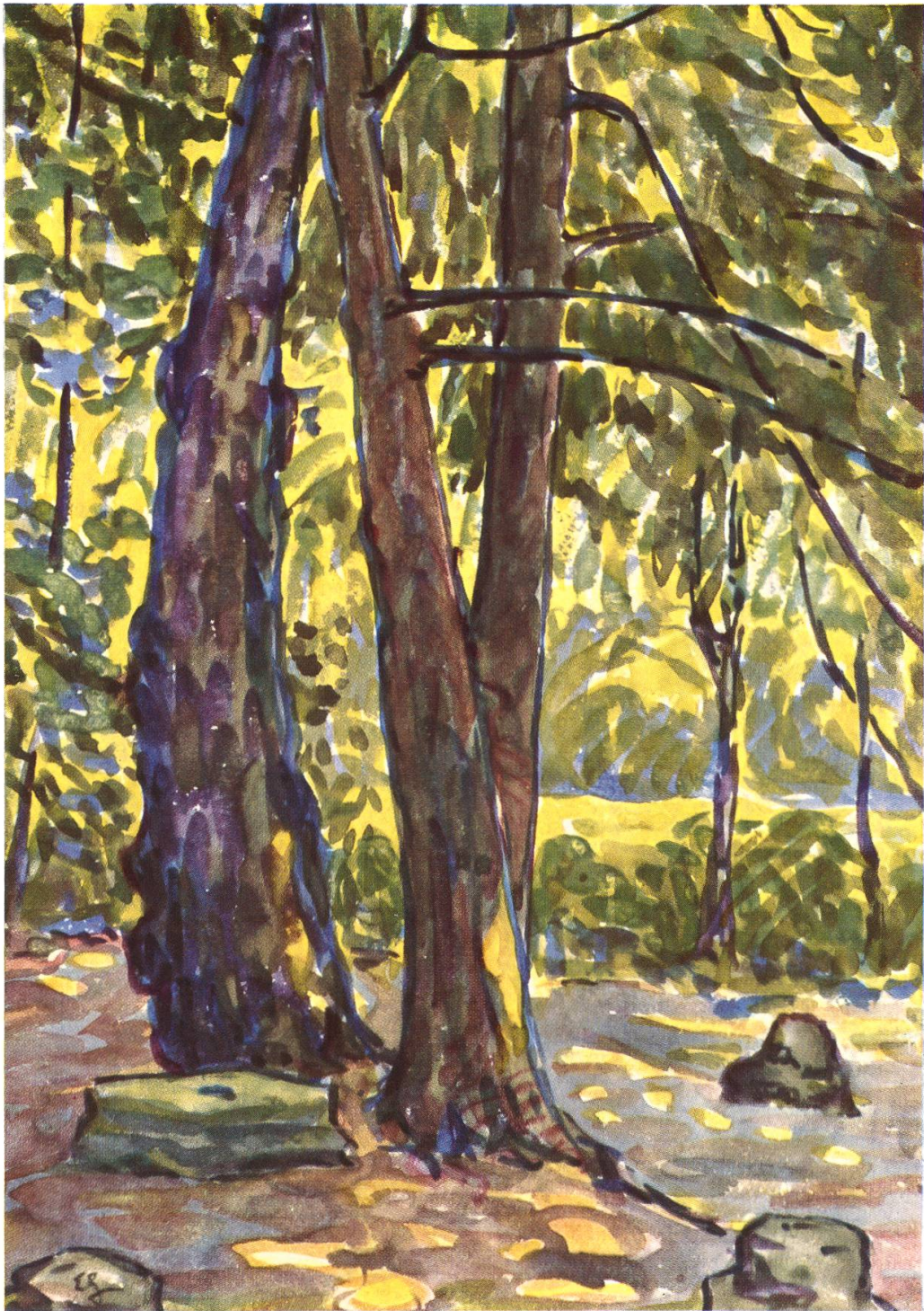
Brugg. — Stadthaus (ehemaliges Geiger-Haus), Park (Aus einer Mappe «Stadthausquarelle» von Ernst Geiger, in Brugger Privatbesitz)