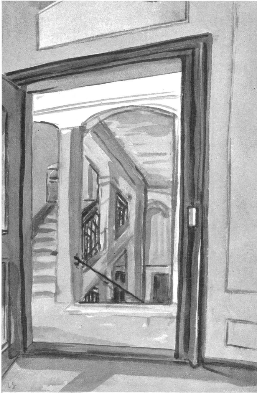
Brugg. — Stadthaus (ehemaliges Geiger-Haus) Blick auf Gang und Treppenhaus aus dem grünen Zimmer im ersten Stock (Aus einer Mappe «Stadthausaquarelle» von Ernst Geiger, in Brugger Privatbesitz)