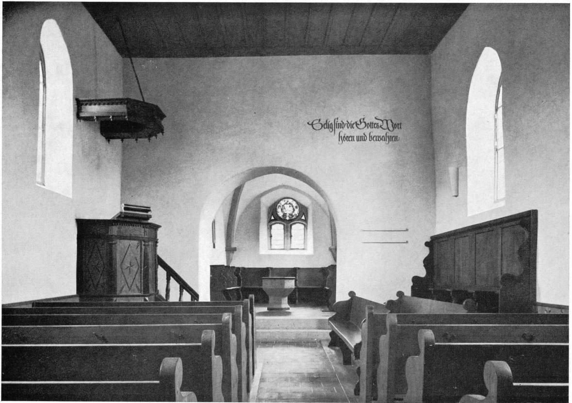
Mönthal. — Pfarrkirche. Inneres nach der Renovation von 1958