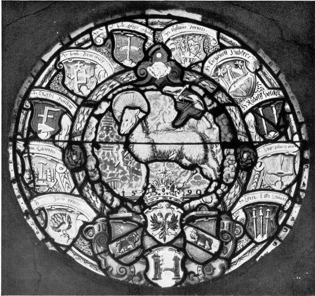
Mönthal. — Pfarrkirche. Rundscheibe mit Lamm Gottes und Wappen der Ratsherren von Brugg 1590

Aus Die Kunstdenkmäler der Schweiz, Kanton Aargau II