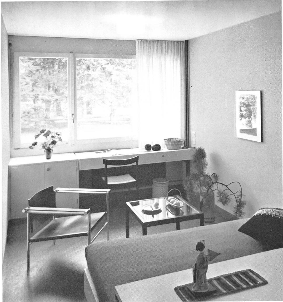
Königsfelden — Schwesternhaus 1964