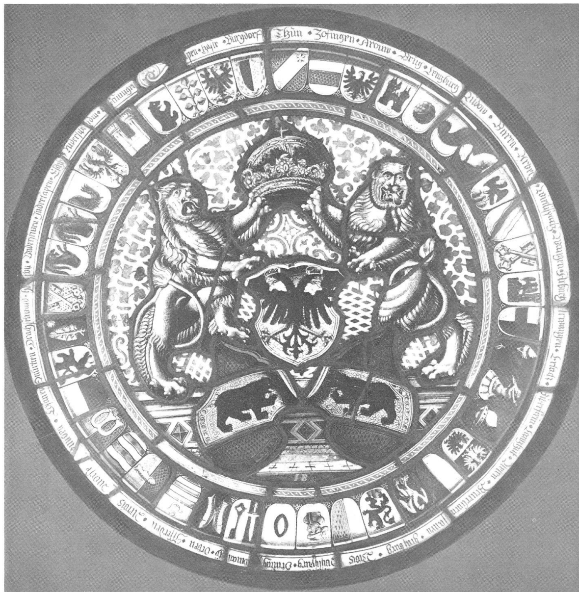
Runde Berner Ämterscheibe 1577 (Landesmuseum Zürich)