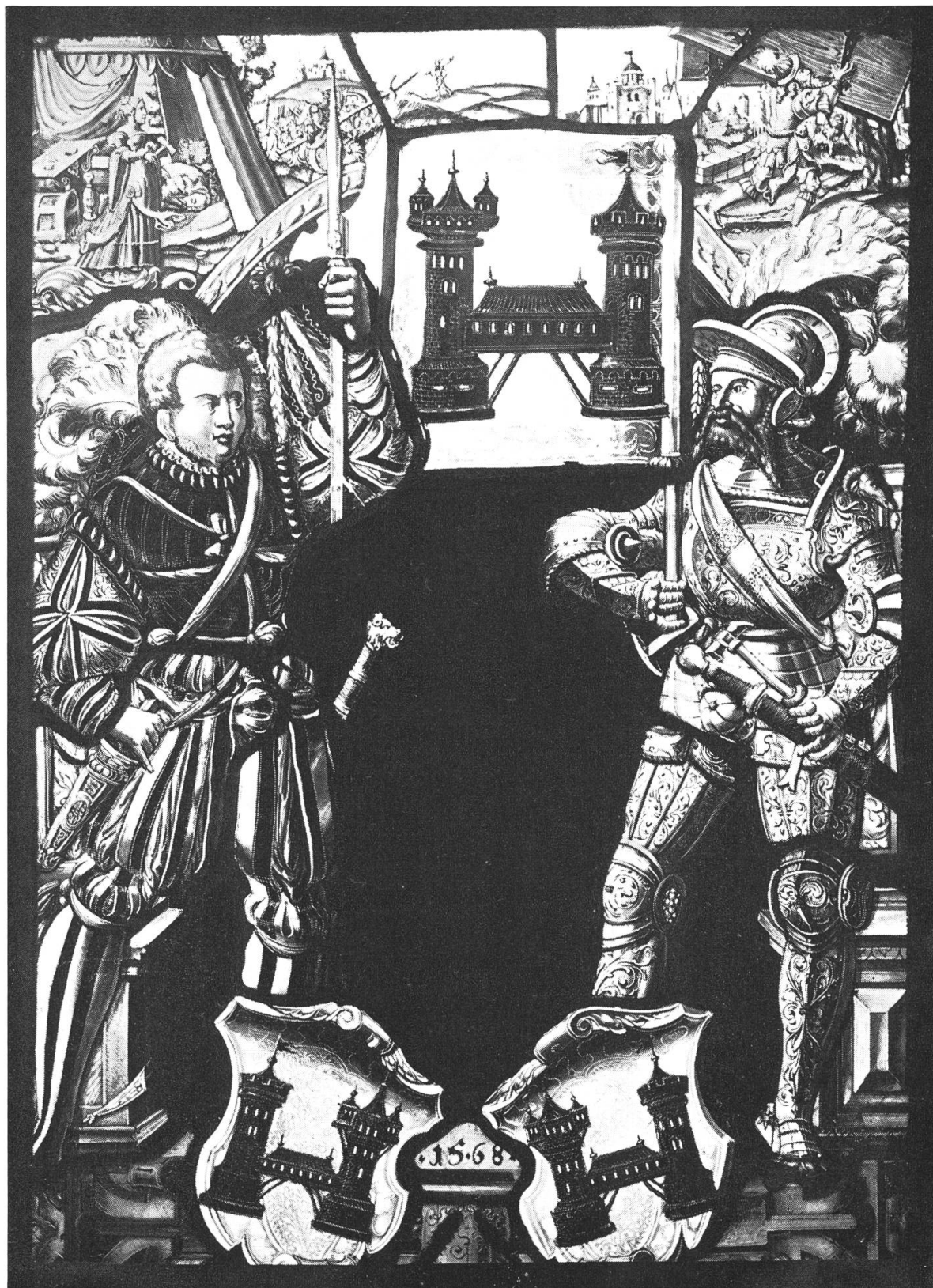
Brugger Stadtscheibe 1568 (Bern, Historisches Museum)