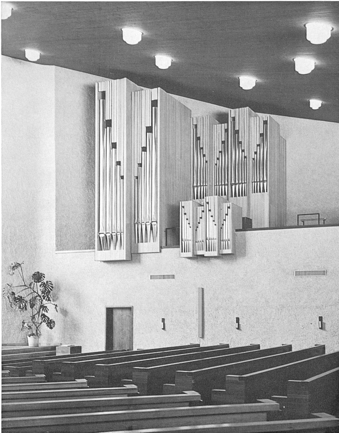
Windisch. – Marienkirche: Orgel