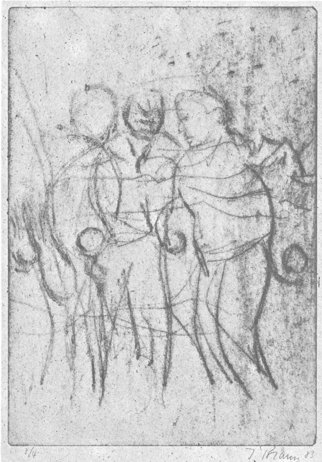
Joueurs de boules