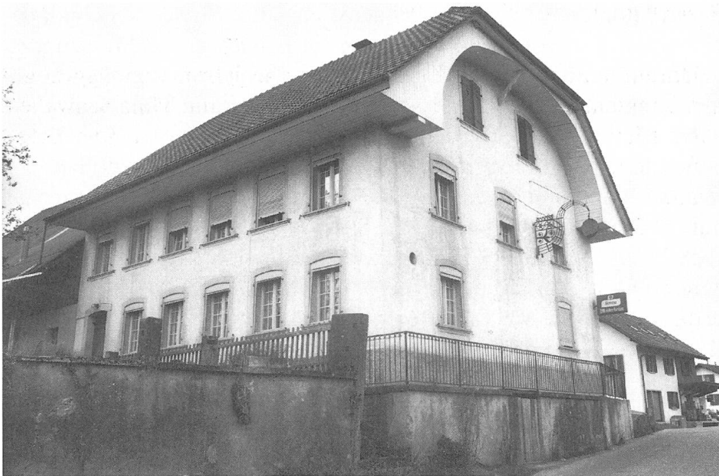
Krüppelwalmdach und Bogengiebel sind die typischen Merkmale der 172 Jahre alten Birrharder Liegenschaft «Sonne».

Der Gemeinderat hatte bereits am 22. Mai des «runden» Jahres 1900 die Installationen dieses heute selbstverständlichen Kommunikationsmittels beschlossen.