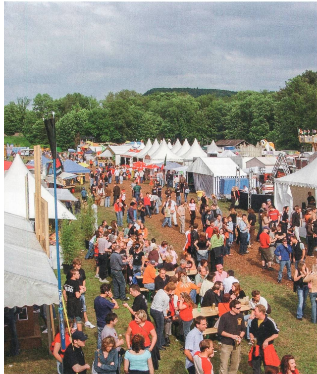
Schachen Brugg, 2005