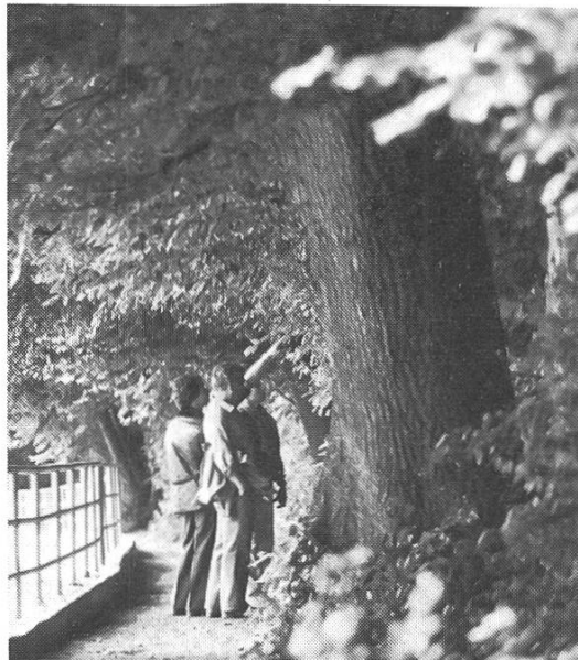
Eine mächtige Stieleiche am untern Promenadeweg entlang der Reuss. Viele Baum- und Straucharten sind hier heimisch.

Nicht nur Menschen und Tiere, sondern auch Pflanzen und besonders Bäume haben ihre Ausdrucksweise — freilich