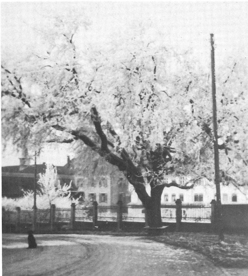
Der Maulbeerbaum an der Luzernerstrasse.

Die auf das wesentlichste beschränkte Bild- und Textinformation soll den Spaziergängern und Waldfreunden helfen, die natürliche Umwelt besser kennen zu lernen. Wer etwas über Bäume und Sträucher weiss, wird bereichert von seinen Wanderungen nach Hause kehren. Bäume und Sträucher sind nicht bloss anonyme Silhouetten am Weg. Sie werden plötzlich zu guten Bekannten, deren Namen man kennt und von denen man weiss, dass sie nicht alle dasselbe grüne Kleid tragen.