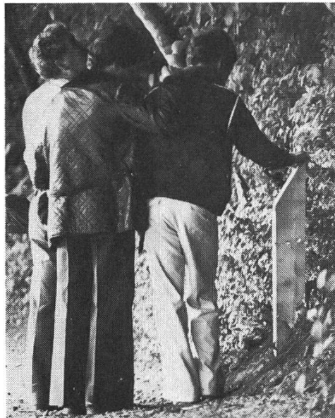
Wie heisst dieser Baum? Die Tafel auf dem Pfahl gibt Auskunft.

Nicht alle Holzarten entfalten ihre grösste Lebenskraft unter denselben Umweltbedingungen. Die vorbeischiessende Reuss hat in ihrem Lauf schon manches Ufer bespühlt, an welchem ganz andere Umweltbedingungen herrschen. Vom rauhen, baumlosen Urserental, durch Erlengehölze im Urnerland, vorbei an Föhrenhorsten auf Felsklippen am Vierwaldstättersee und bei Gersau das Sonnenlicht in die Kastanienhaine am Südfuss des Rigi zurückwerfend, gelangt die Reuss in den Aargau. Hier findet sie eine Gegend, welche von Natur aus vorwiegend mit Buchenwald bedeckt wäre. Doch nur an den steilern und schattigen Uferhängen gelangt der Buchenwald bis in unmittelbare Nähe der Reuss. Der Fluss selbst hat das Gelände gestaltet und dadurch für den Wald in seiner Nachbarschaft