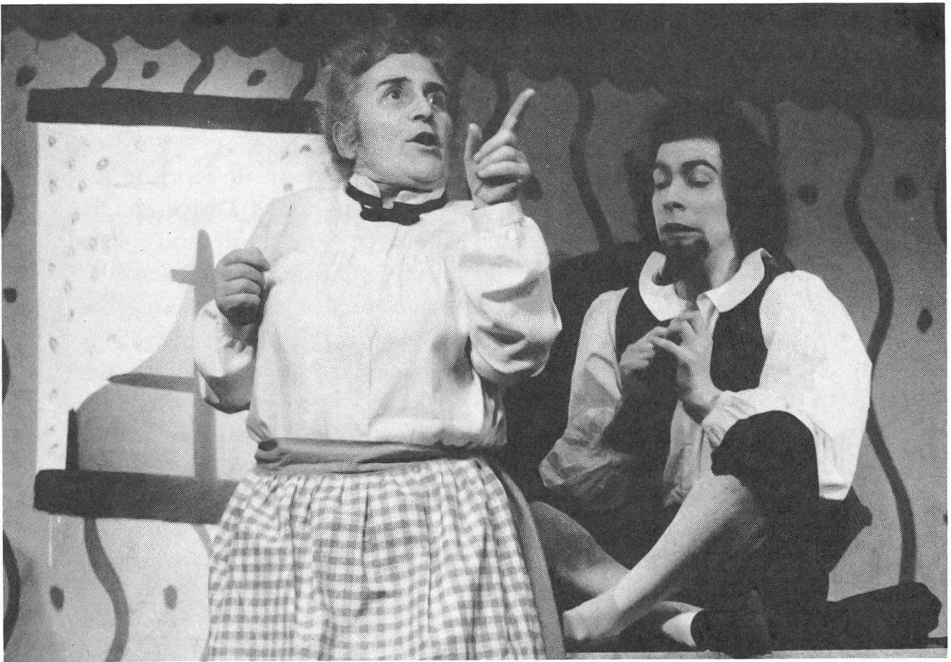
« Das tapfere Schneiderlein », 1975 – Hanny Krauter, Erich Borner