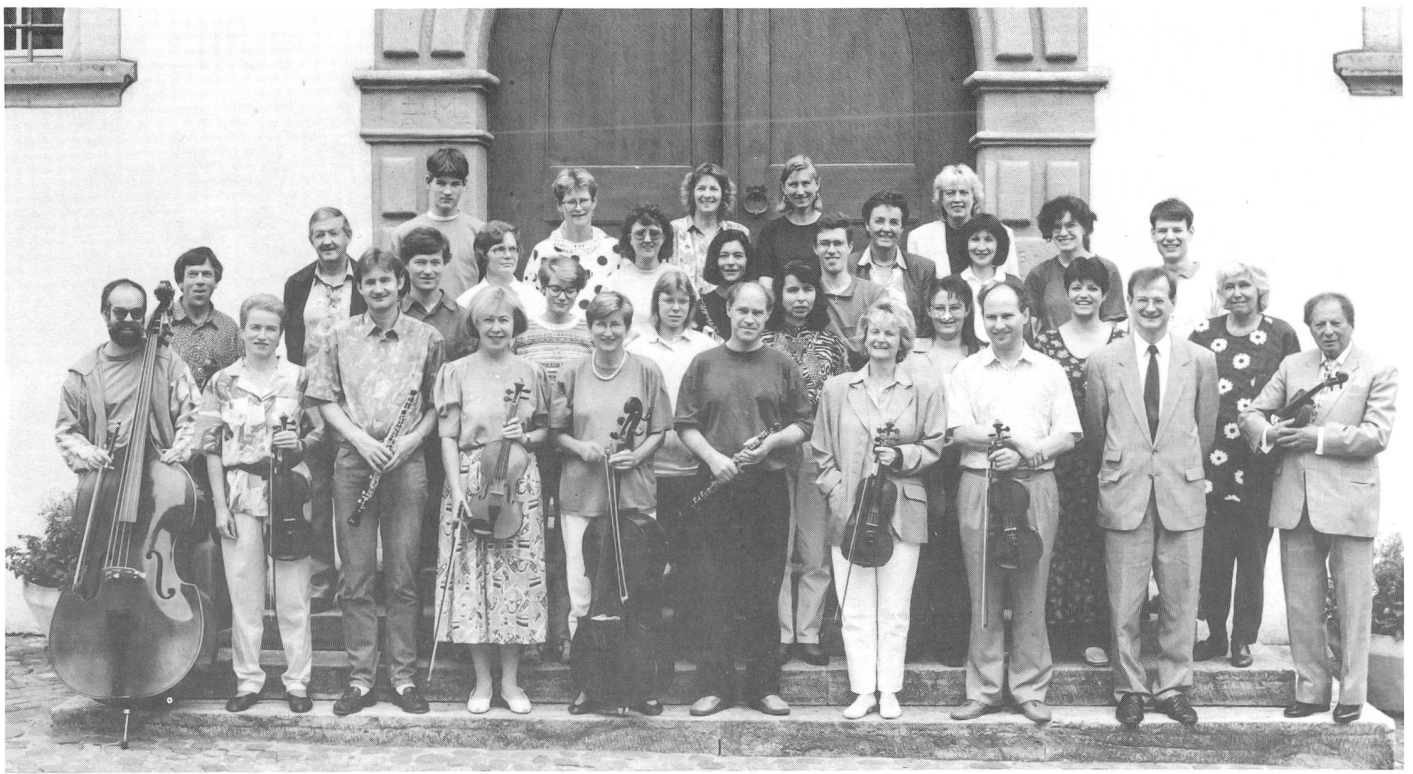
Bild: Orchesterverein Bremgarten im Sommer 1993