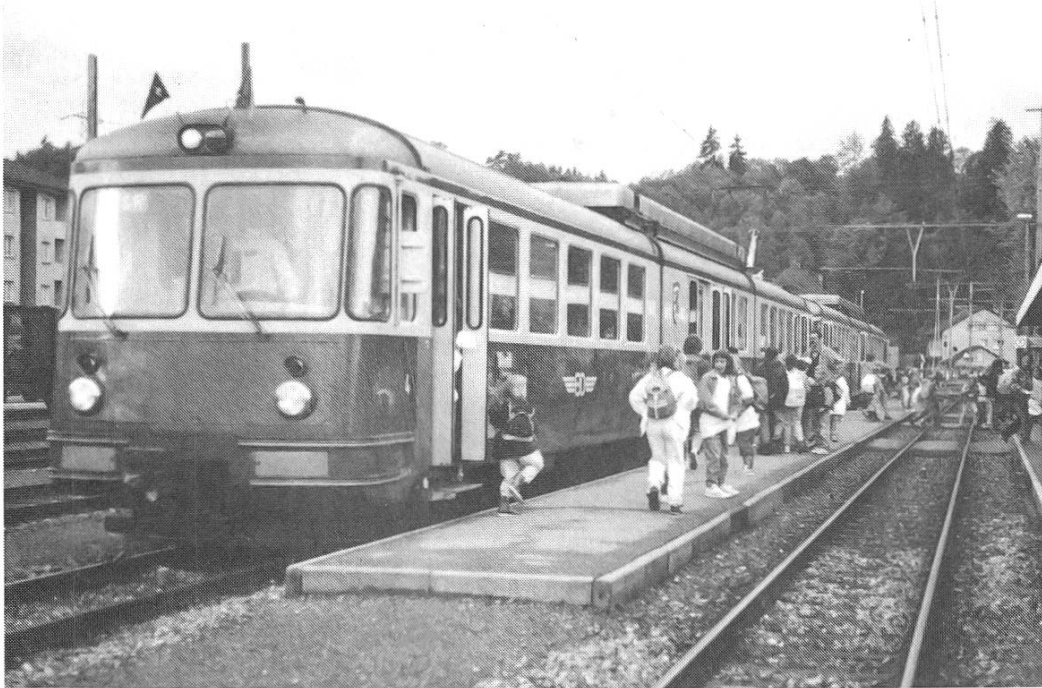
Mit der BD auf die Schulreise