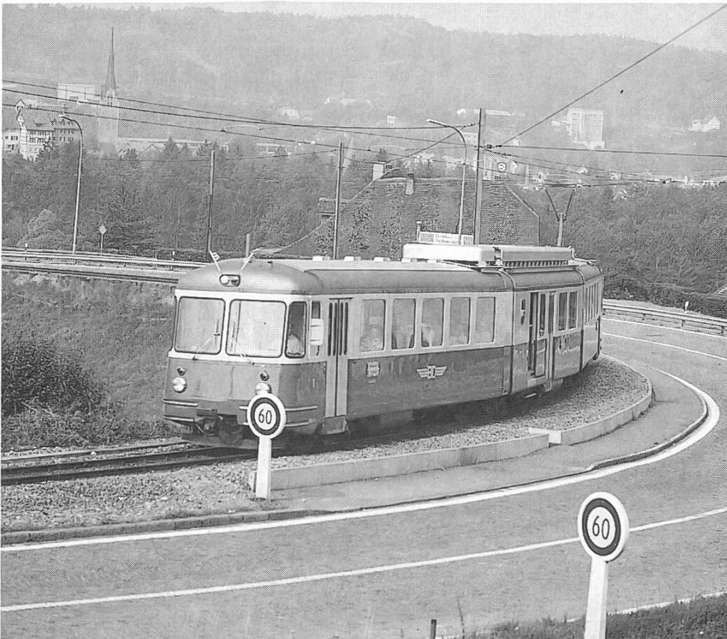
Die BD als Strassenbahn

Der Bremgarten–Dietikon-Bahn wird im Expertenbericht der Charakter eines regionalen Fein- und Mittelverteilers zugeordnet. Mit ganztägig starren Kursfolgezeiten soll sie den Anforderungen eines leistungsfähigen S-Bahn-Zubringers genügen.