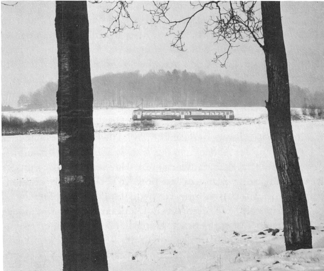
Mit der BD zum Wintersport

Der Regierungsrat wird beauftragt, zusammen mit der Direktion der Bremgarten-Dietikon-Bahn, den zuständigen Bundesstellen und dem Kanton Zürich die skizzierte Leistungssteigerung der BD zügig weiterzubearbeiten und dem Grossen Rat die entsprechende Finanzierungsvereinbarung und weitere notwendige Anträge so rasch als möglich zu unterbreiten.