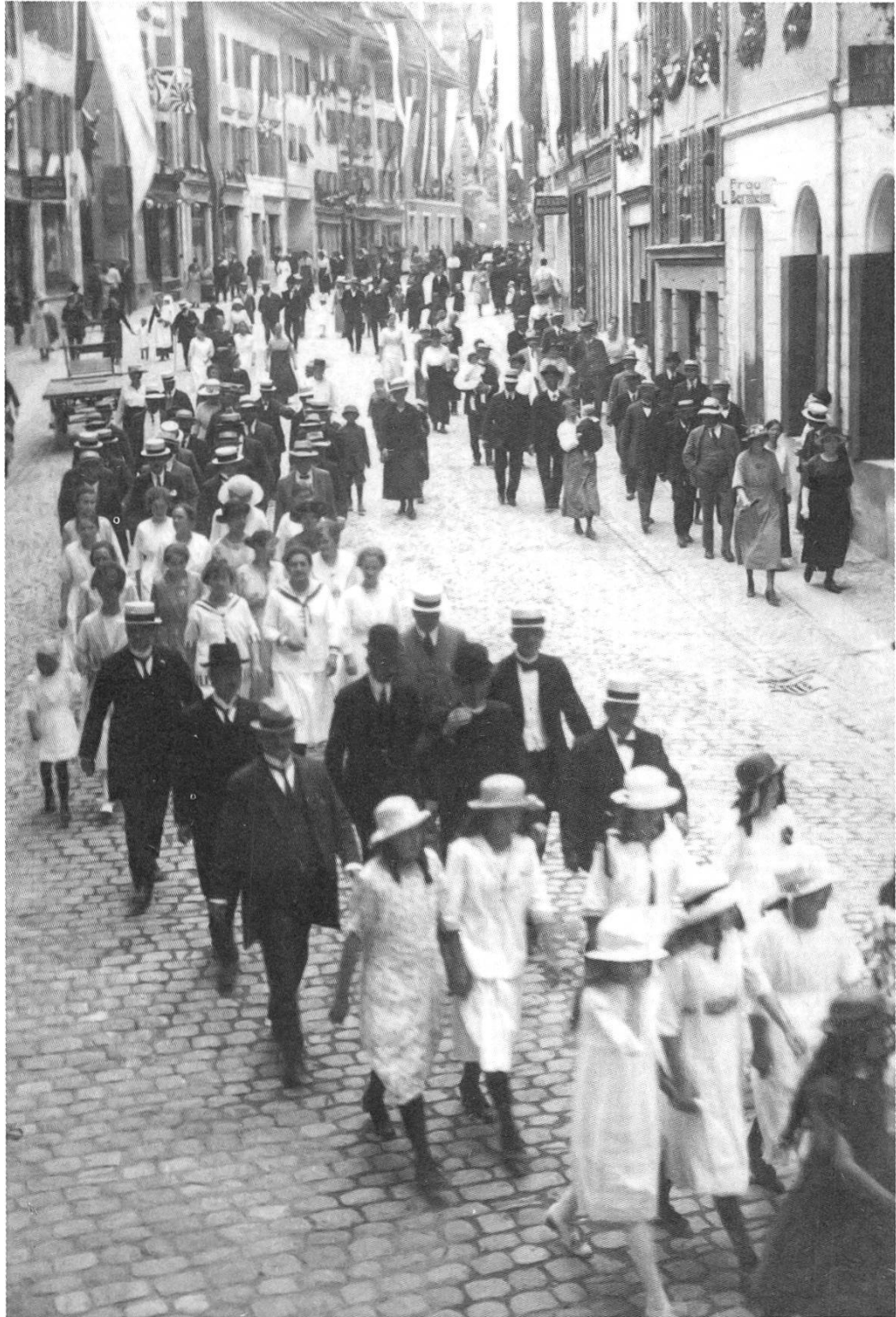
Festzug am Sangerfest 1921