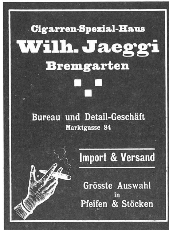
Inserat aus: «Bremgarten und die Bremgarten-Dietikon-Bahn», um 1915