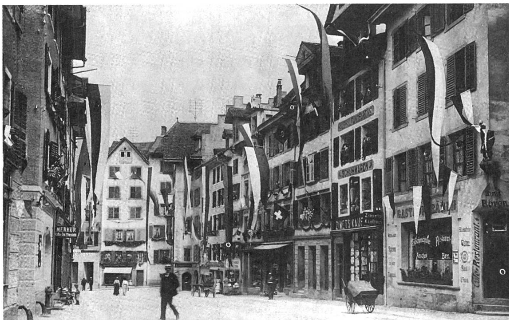
Marktgasse Richtung Bogen, Aufnahme vom Jugendfest 1921

Stark und gut ist seine War'. Schöne Hüte auch für Damen Kannst Du bei «Niffenegger» 23) kramen. Fast neu ist «Zimet's Groß-Kaufhaus». 24) Es nimmt sich ganz auffällig aus. Fast alles kann man bei ihm haben, Und billiger ist kaum ein Laden. Selbst am Sonntag bis um viere Sitzt Herr Zimet vor der Türe; Oben dann der Phonograph spielt Und so das Geschäft empfiehl. Mit Aussteuern, Möbeln und Tuchwaren Kannst Du nirgends besser fahren Als bei uns hier auf dem Platz,