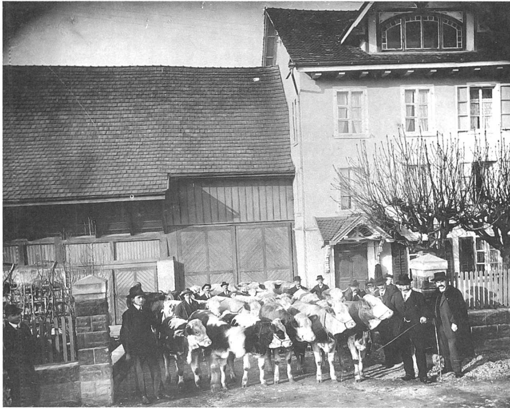
«Willst Du eine Droschke mieten, liesest sie beim Portmann aus»; Liegenschaft Portmann, mit Eigentümer, seinen Angestellten, und Käufern (?), Aufnahme Dezember 1918

Trinkt jeder ein vorzüglich Bier. Jassen kann man hier jetzt immer, Früher war es etwas schlimmer. Willst ruhig Du ein Brieflein schreiben, Steht Dir im «Kreuz» 'ne Stube frei, Hier kannst Du manchmal sitzen bleiben Ohne Zwang zur Trinkerei. Im «Schwert» kannst gute Wähen essen, 6) Das darf kein Reisender vergessen.