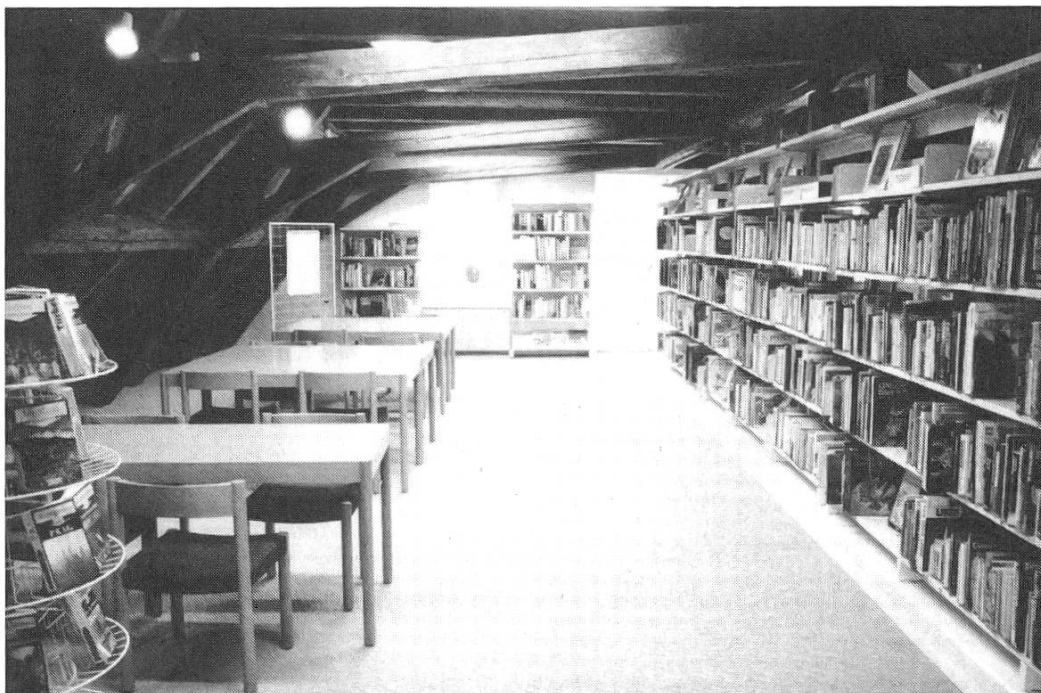
Das seit 1990 in die Bibliothek integrierte Dachgeschoss

Das Ortsmuseum, für das das Dachgeschoss reserviert war, war bis zu diesem Zeitpunkt nicht zustande gekommen, so dass die Ortsbürgergemeinde einwilligte diese Räume, direkt über der Bibliothek, dieser zur Verfügung zu stellen.