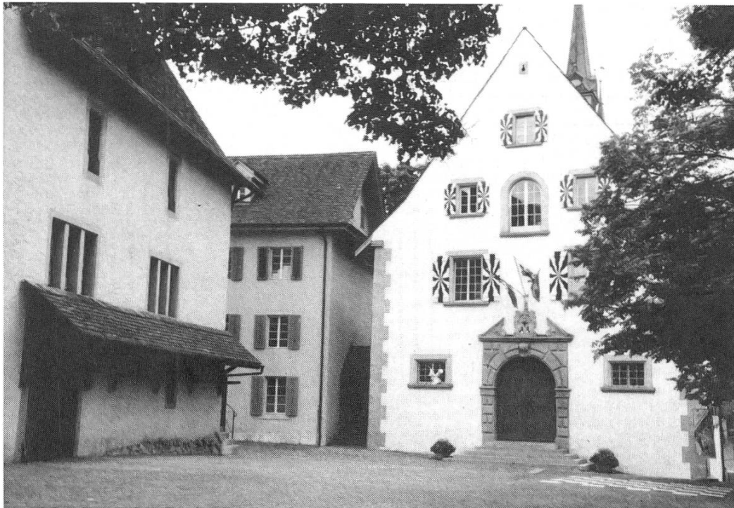
Schellenhausplatz mit Schellenhaus, Oberer Zoll und Zeughaus

1969 gab es einen Wettbewerb, den das Architekturbüro Oswald gewann, der aufzeigte, wie der Schellenhausplatz und die umliegenden Bauten, Zeughaus, Polizeiposten und Schellenhaus genutzt werden könnten. Nachträgliche Programmänderungen führten dazu, dass das Wettbewerbsprojekt nicht zur Ausführung kam. Nur das Schellenhaus konnte mit einer