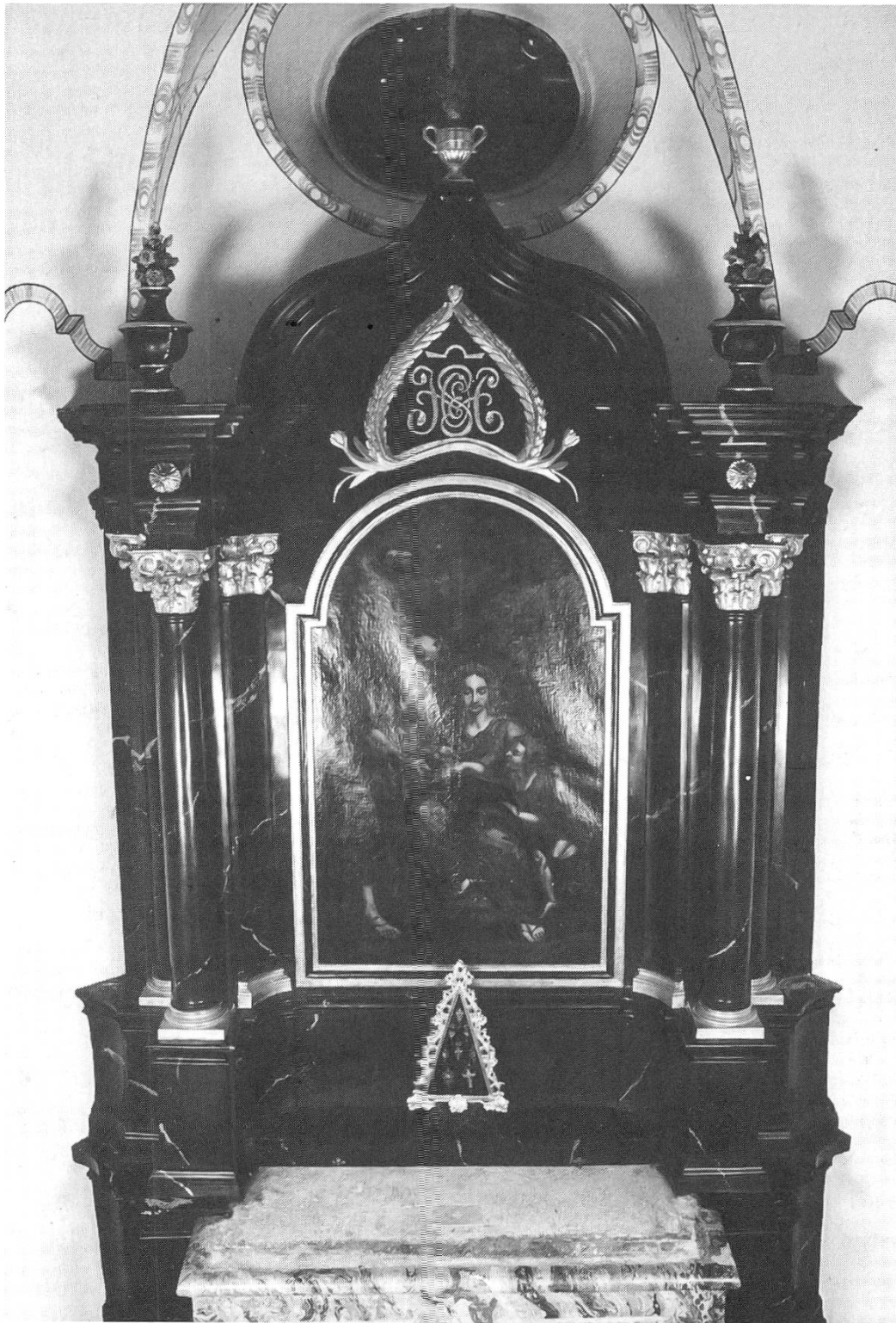
Seitenaltar rechts: Zustand nach 1995