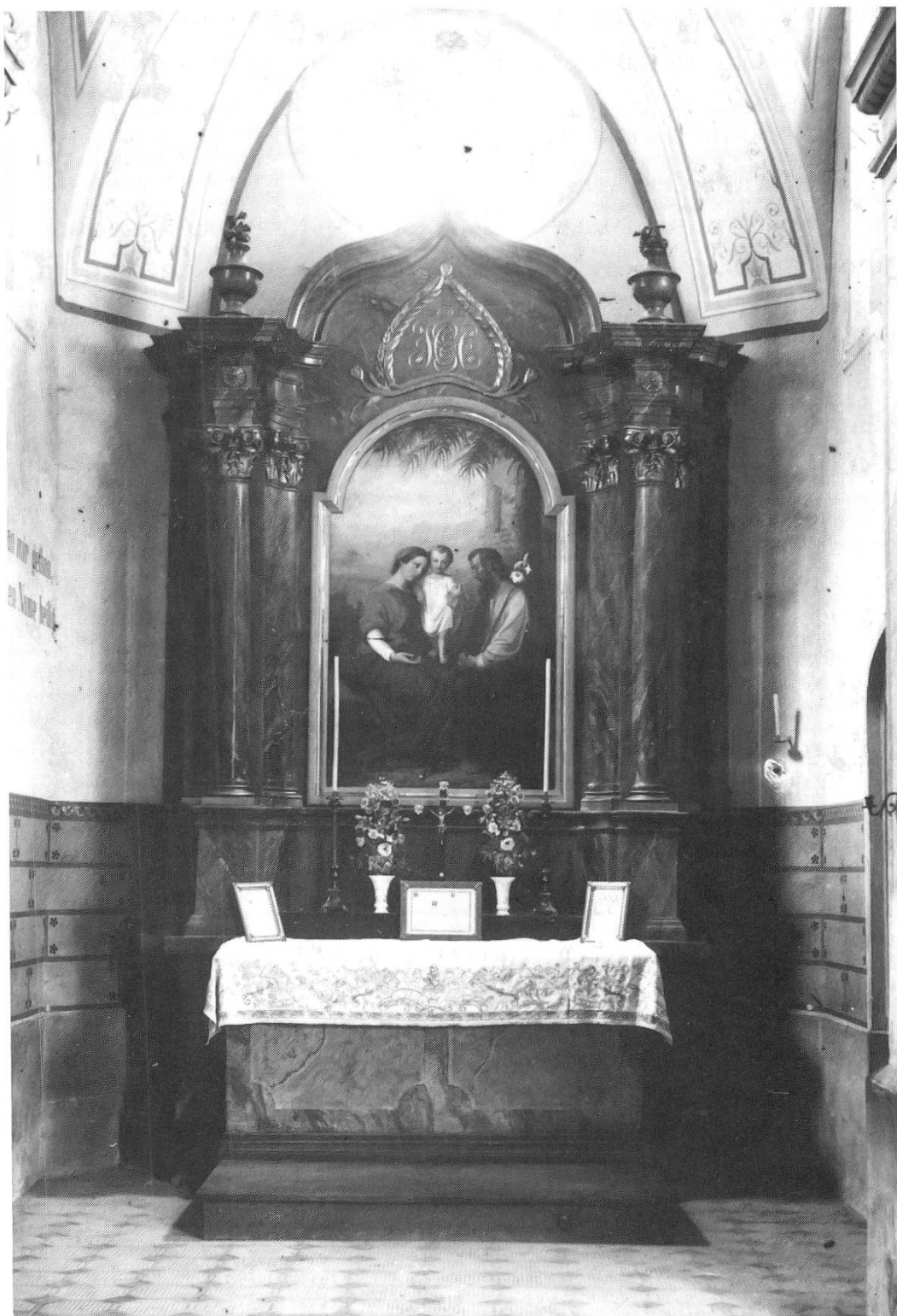
Seitenaltar rechts: Zustand vor 1962