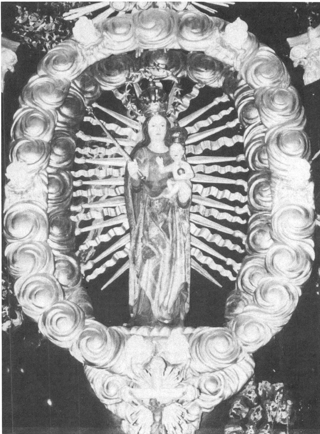
Gnadenbild: Prunkstück des Hochaltars. Die von Strahlenkranz und doppelter Wolkengalerie gesäumte Madonna