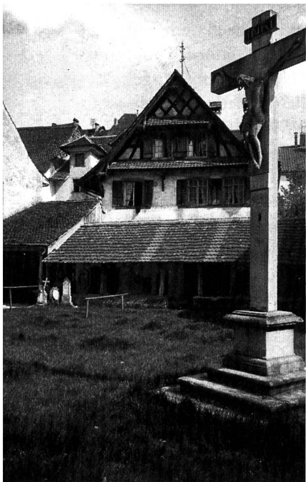
Das Organistenhaus im Kirchenbezirk. Zur Besoldung des Musikdirektors gehörte die unentgeltliche Amtswohnung.

bach bei seiner Berufung die Hände im Spiel hatte. Der junge Fürsprech, Sohn des bereits verstorbenen gleichnamigen Ständerats, war seit 1863 Präsident der Musikgesellschaft. Er stand wie sein Vater auf der Seite der Freisinnigen und sollte später berühmt werden als Eisenbahnfachmann, als einer der Schöpfer der SBB und als deren erster Generaldirektionspräsident. Er gehörte wahrscheinlich damals zu Osenbrüggens « jüngern Männern » mit der « üblen Gewohnheit, am Bürgerzopf zu zupfen ».