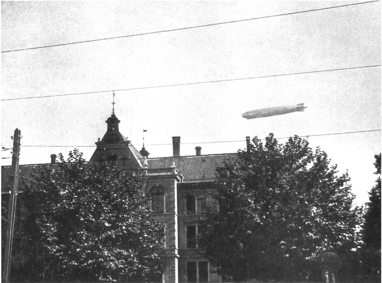
Der Zeppelin über dem Stadtschulhaus. Schnappschuss aus dem Jahr 1931.