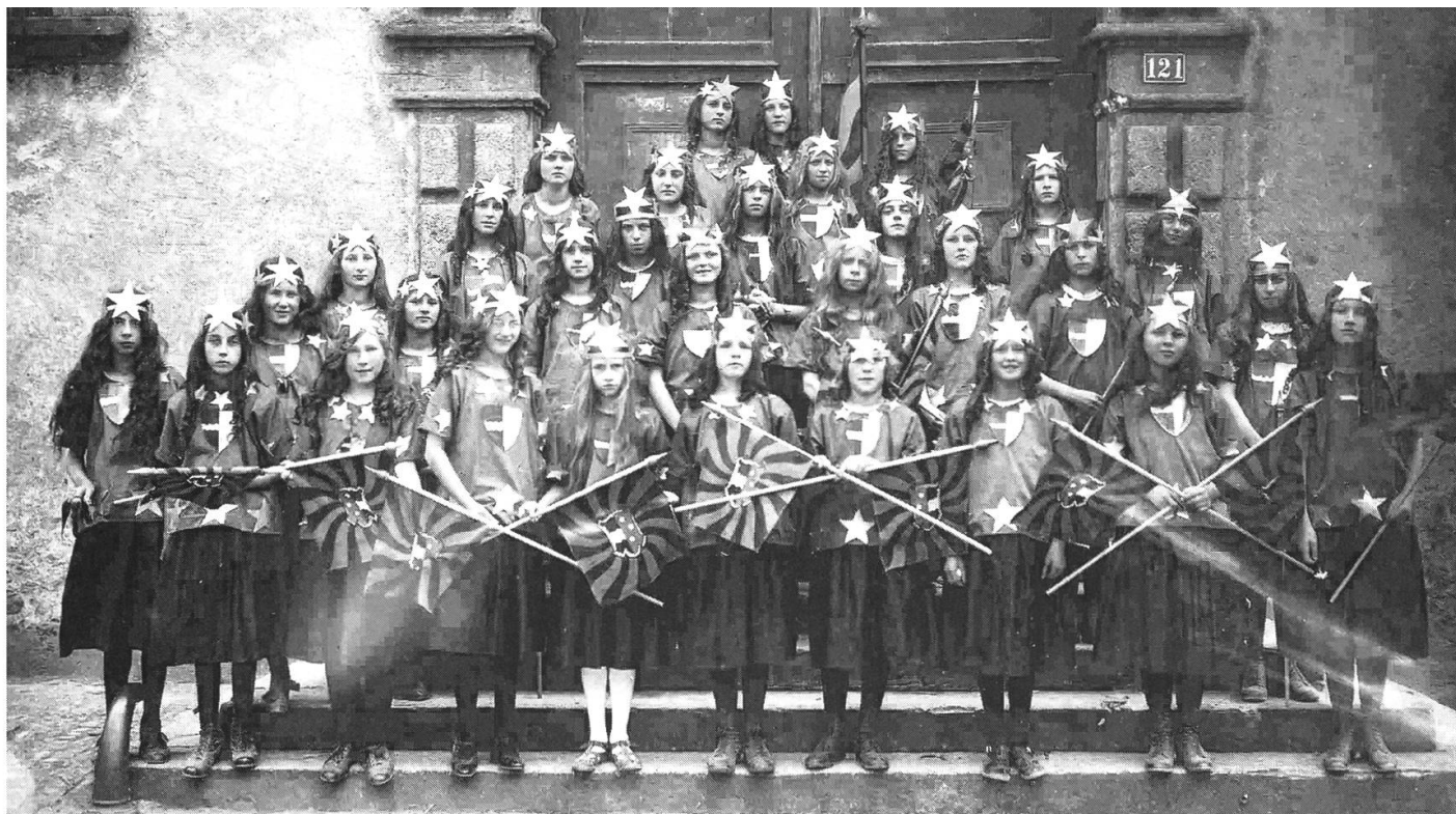
Die Verkörperung des Kantons Aargau am Jugendfest 1921.

Besoldungsgesetz ab – « Kommentar überflüssig » steht dabei. 1920 ist das Resultat nicht viel besser und der (privat) kommentierende Rektor ist sich nicht sicher, ob er in « gelbem Neid, Schulfreundlichkeit oder einfach Dummheit des Stimmvolks » eine Erklärung suchen sollte. Wie zum Trost setzt er das positive Abstimmungsresultat für den Beitritt des Völkerbunds daneben, auch wenn der Zusammenhang zur Bezirksschule Bremgarten hier nicht ganz offensichtlich ist. Noch tröstlicher dürfte freilich gewesen sein, dass die Gemeinde in jener Zeit dann doch alle paar Jahre eine Lohnerhöhung oder Teuerungszulage gewährte.