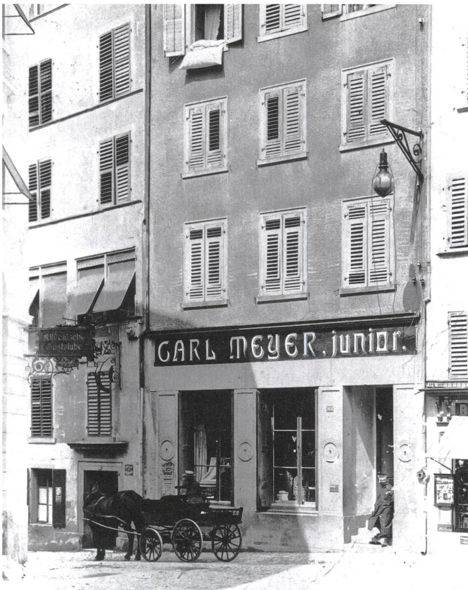
Lichtbogenlampe in der Marktgasse an der Liegenschaft Meyer. Die Bedienungseinrichtung und die Anschlussdrähte sind sichtbar.