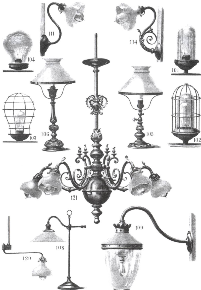
Leuchten für den gepflegten Haushalt aus dem Katalog der Maschinenfabrik Oerlikon (MFO) 1889. In diesen Leuchten wurden Kohlefadenlampen eingesetzt.

An der Elektrizitätsausstellung in Paris von 1881 präsentierte Thomas Alfa Edison dem Publikum das angenehm warm leuchtende Licht seiner Kohlefaden-Glühlampe. Diese konnte mit einem einfachen Schalter angezündet und gelöscht werden. Das elektrische Licht war damit für Menschen und Haushalte nutzbar geworden. Diese epochale Entwicklung veränderte die Lebensweise der Menschen.