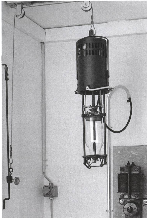
Die Lichtbogenlampe im Museum Reusskraftwerk mit Schalter, Vorschaltgerät und der Zugvorrichtung, welche erlaubte, die Lampe vom Boden her zu bedienen.