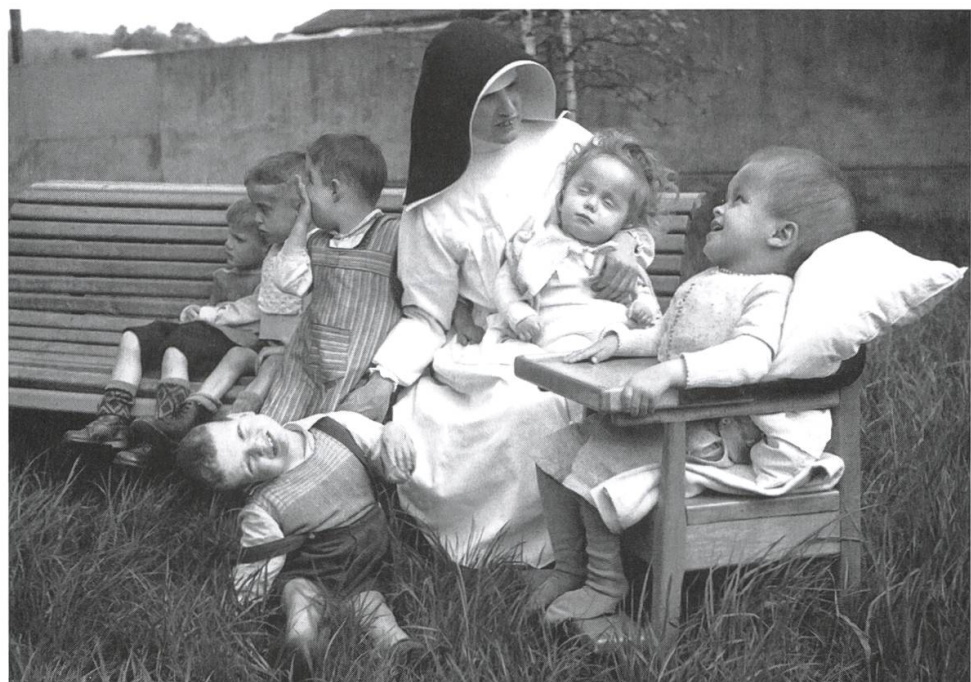
In der Zuwendung bei der alltäglichen Pflege und Betreuung.

«Die Front unserer Kirche schmückten seit ca. 60 Jahren zwei prächtige Lärchen. Mit Rücksicht auf die Gebäulichkeiten mussten sie gefällt werden, junge Zypressen zieren nun den Eingang zum Gotteshaus.»