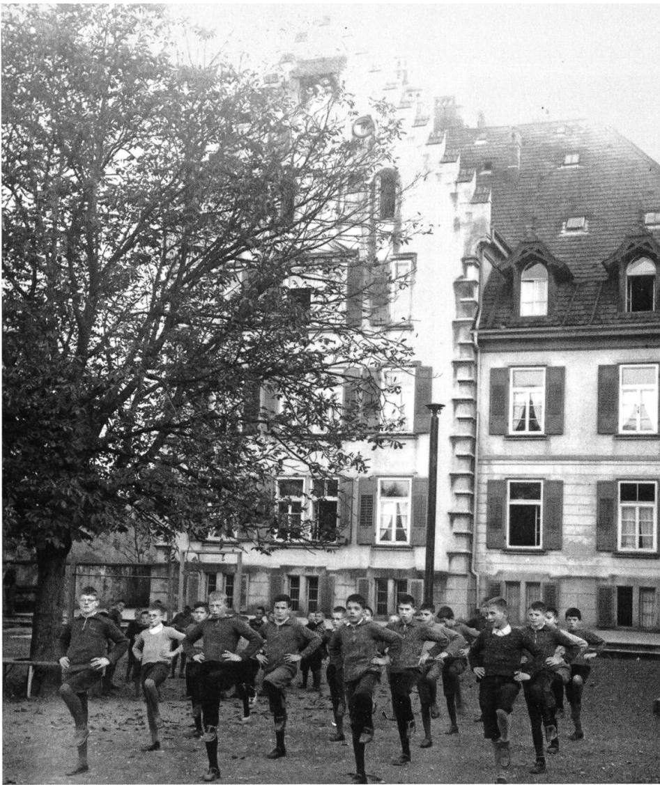
Turnstunde mit fast militärischem Drill – und es scheint doch Spass zu machen.

Zur Eigenversorgung wurden Hühner und Schweine gehalten, dazu die Aussage: «Nebst verschiedenen Renovationsarbeiten kommt auch der Schweinestall zu einem Anbau, der sich für die drei Dutzend Abfallfresser geradezu wohnlich ausnimmt».