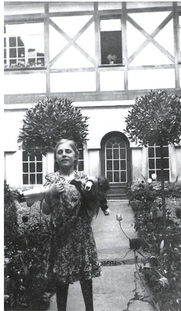
Im Klösterli-Innenhof dagegen ist die typische Bepflanzung mit Buchshag und Blumenbeeten erkennbar.