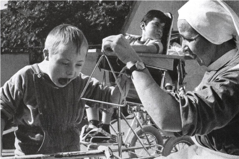
In der Wohngruppe.