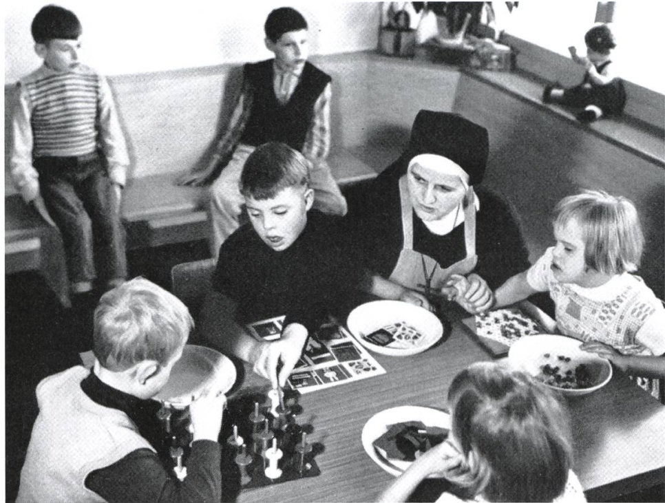
In der Schule.

Eindrücklich wurden die kirchlichen Feste gefeiert. Die hohen Festtage, besonders Weihnachten und Ostern, Erstkommunion und Firmung wurden intensiv vorbereitet und gestaltet. Der Josefstag (19. März) war das eigentliche Hausfest.