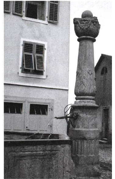
Der Rathausbrunnen mit der Risischeune im Hintergrund um 1945. Neben dem Brunnen ist eine Ecke des Braunschweighauses zu sehen, welches in den 1970er Jahren der Rathäuserweiterung weichen musste.

Man einigte sich vorab das Wasser abzulassen. Der Auslauf mit dem vorhandenen Durchmesser prognostizierte einen zu erreichenden Leerzustand erst nach Ablauf einer Stunde. Die aus dem Wasser ragenden Körperteile des Pferdes wurden durch kräftige Hände mit Stroh trocken massiert: Das war die Idee von Milan Dreifuss aus dem benachbarten Braunschweighaus. Derweil mussten wir Jungen in Windeseile aus der Scheune gegen 50 Wellen anschleppen, um eine zweiseitige Rampe zu bauen, von innen nach