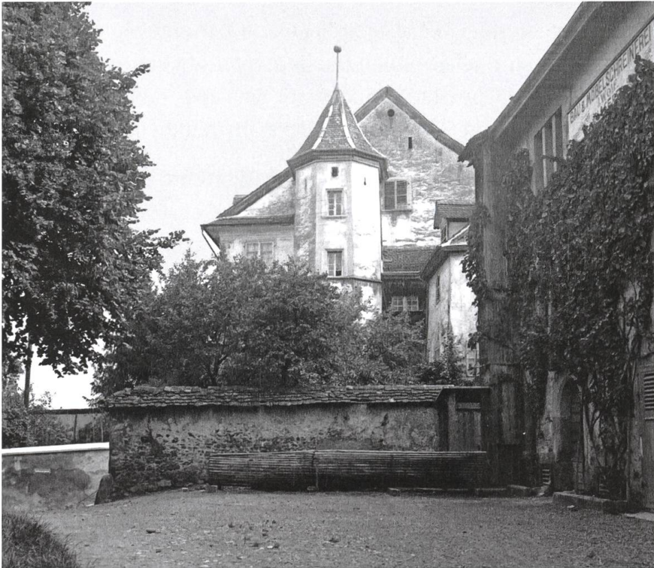
Das Schellenhaus mit Kegelplatz um 1940. An der Ecke das ange- hängte Plumpsklo. Hinter dem Tor rechts war das Feuerwehr- magazin. Vor dem zweiten Stockwerk hängt die Tafel der Schreinerei Wolf.

man den armen Leuten nicht als Existenzminimum gelassen hat. Es standen Stühle, Tische und Kästen herum.