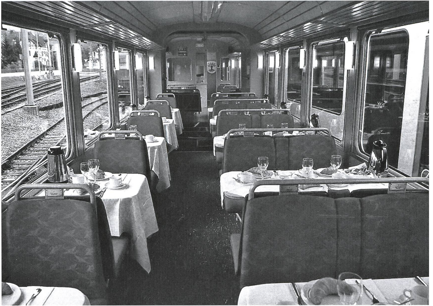
Innenansicht des Sebni.