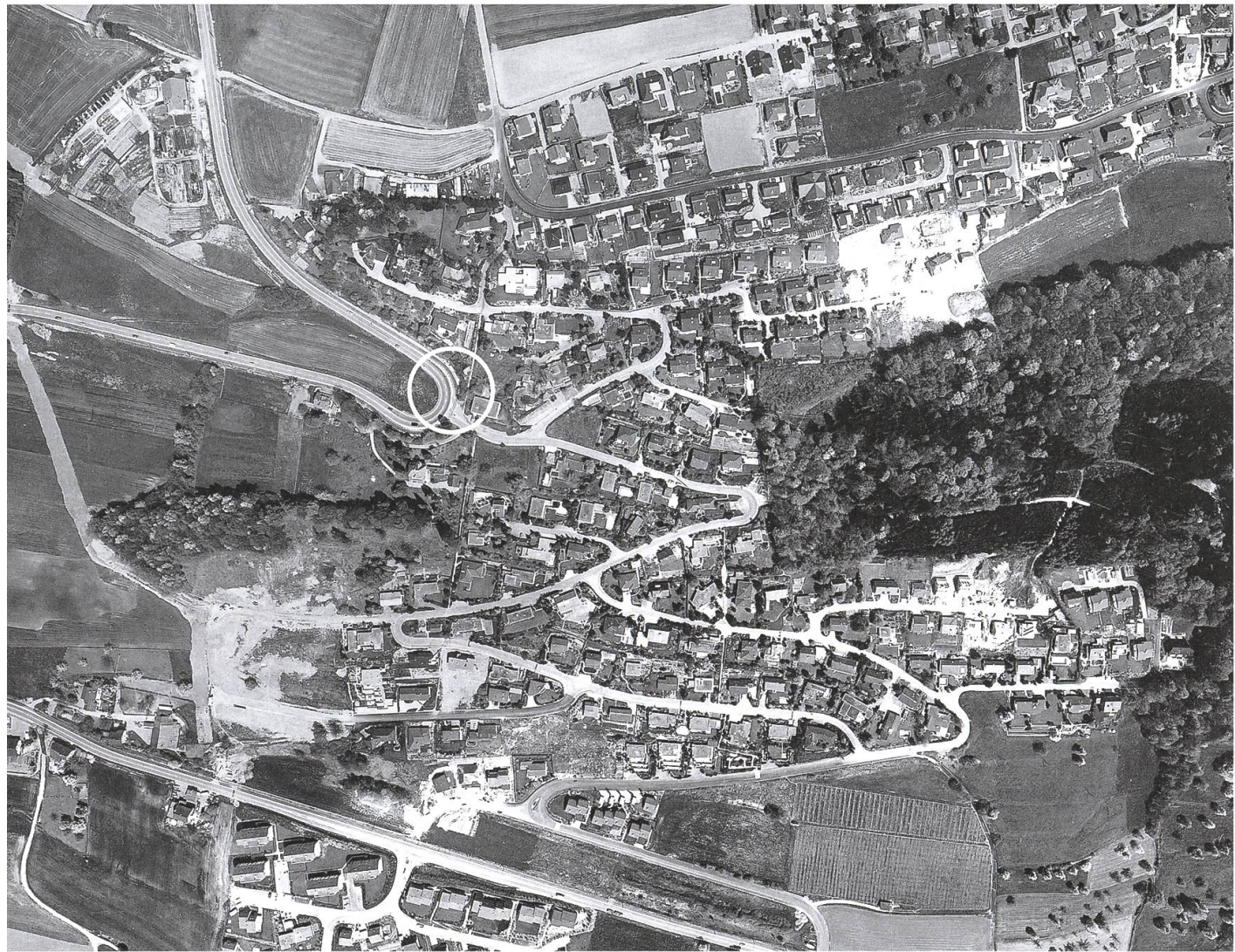
Belvédère und Hammergut 1983.

1. Preis einem Bremgarter Wagen zukam, da doch der Mostclub Zufikon sicher die originellste und beste (auch teuerste) Aufmachung hatte. Ich glaube, die Bremgarter Jury machte die Preisverteilung schon vor dem Umzug.» 9 Die Schpitelturm-Clique antwortete am 18. Februar: «Scheinbar ist der Erboste kaum ein Fastnächter, sonst hätte er merken müssen, dass es sich bei einem solchen Umzug vorab um fastnächtliche Sujets handeln muss. Die lebendige, grosse Gruppe des Mostklubs und den aufwendigen Wagen in allen Ehren – was der 2. Rang beweist –, aber ein Fastnachtsumzug ist keine Werbeaktion für Most oder dergleichen.» 10