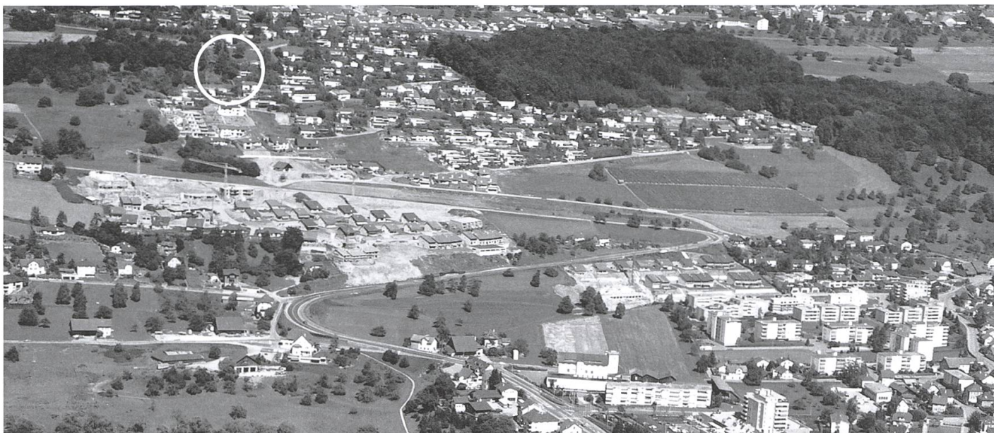
Belvédère und Hammergeut 1981.