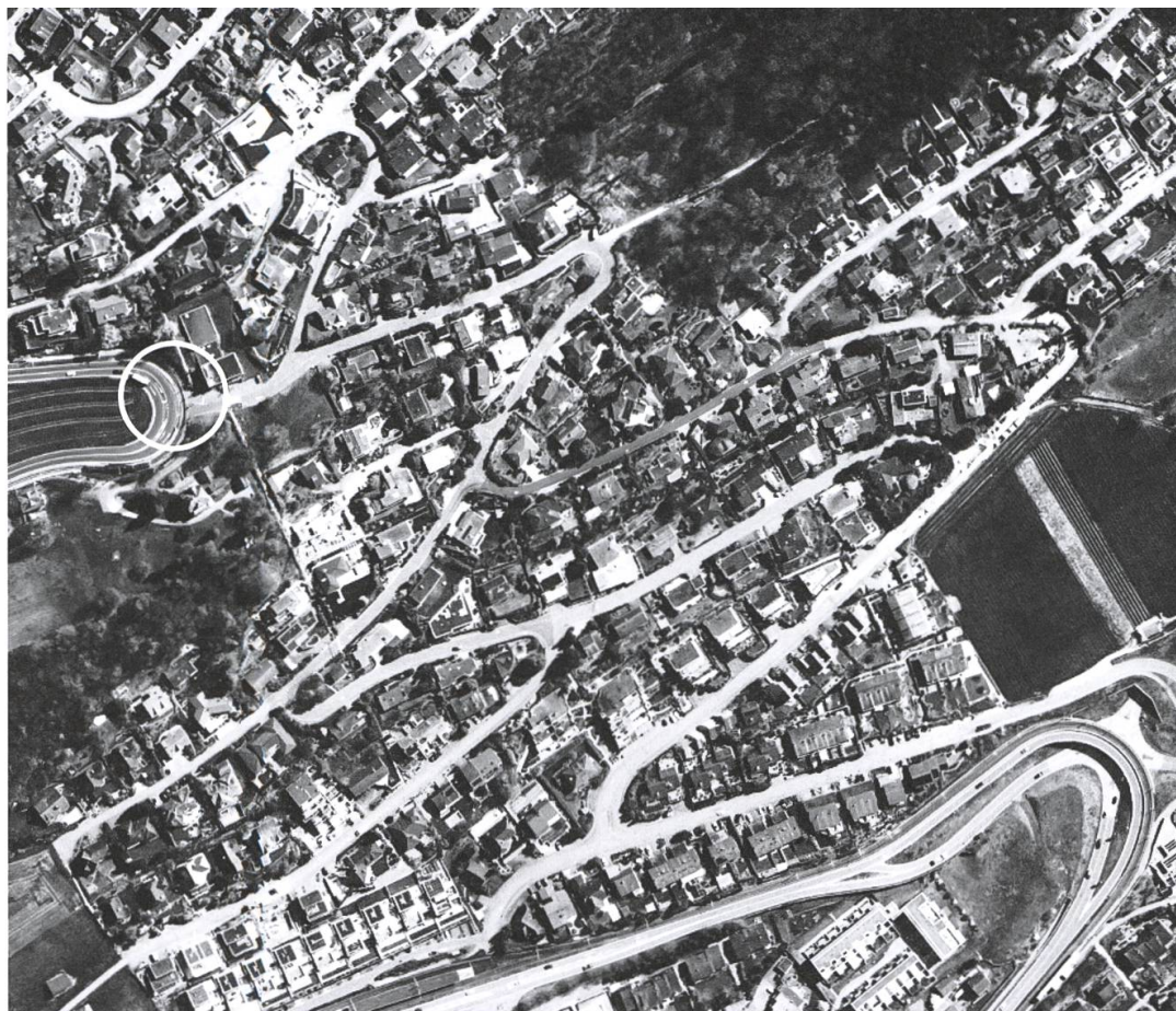
Zufikon 2017.

chen Jahr Konkurs anmelden musste, merkte man, dass die Sicherheiten nicht genügten. Die Rechnungsprüfungskommission kommentierte das Geschehene an der ordentlichen Gemeindeversammlung vom 27. Juni 1975 so: «Nach unserem Dafürhalten wurde die Anlage vom Gemeinderat vorschriftswidrig getätigt. Zur Zeit steht nicht fest, wie gross der Verlust aus diesem Geschäft ist und wer für einen allfälligen Schaden aufzukommen hat.» (11) Zwei Monate später musste der Gemeinderat an der turbulenten ausserordentlichen Gemeindeversammlung vom 22. August 1975 einige Vorwürfe einstecken, sich Wörter wie «Machenschaften» gefallen lassen – ebenso wie die Forderung, die Gemeinderäte hätten persönlich für den Schaden zu haften.