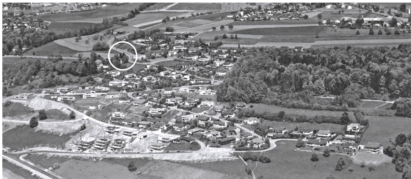
Belvédère 1974.

sie von den Tatsachen gelöst und dem eigenen Überlegenheitsgedanken gefrönt hat?