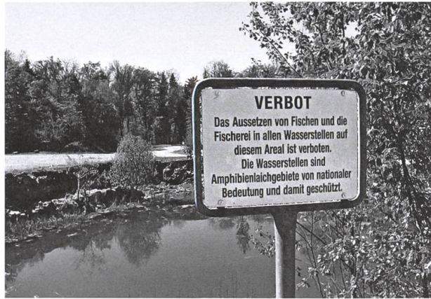
Hinterweid – militärisches Übungsgelände mit Naturschutzzonen.