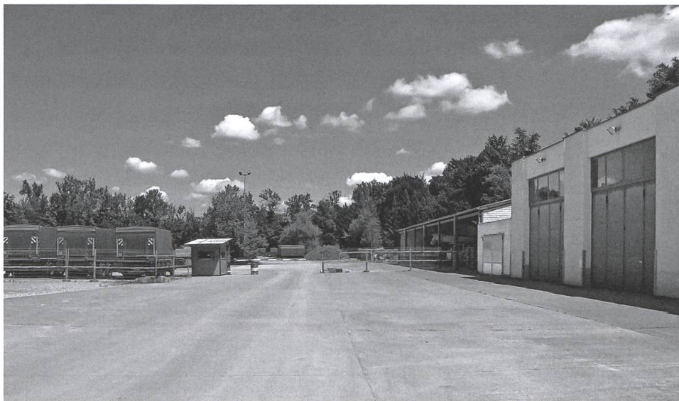
Usser Weid (Stierliweid) – Theorieräume und Baumaschinen der Armee.