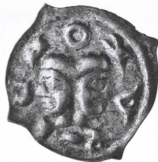
Zürcher Angster (Pfennig) aus dem späten 13. Jahrhundert mit den Köpfen der Heiligen Felix und Regula. Schweizerisches Nationalmuseum, Inv. M-13444.