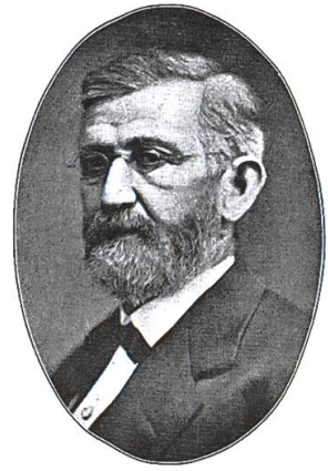
John Moses Brunswick.

1841 verbot der sich liberal gebärdende Kanton Aargau die Klöster, weil sie ihm ein Dorn im Auge waren. Die Eidgenossenschaft bildete noch nicht jenen Bundesstaat, der dann 1848 gegründet wurde. Bremgarten als Stadt war damals nicht mit bedeutender Industrie gesegnet. Die Stadt begann sich ab 1800 schrittweise von den Fesseln der Stadtmauern zu lösen und signalisierte damit, nur zart angedeutet, dass sie sich in ein modernes Zeitalter aufmachen wollte.