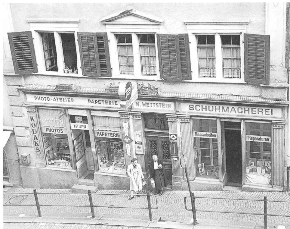
ohne Datum.